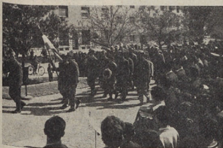
Odred veterinarjev prihaja pred spomenik svobode v Kočevju, kjer ga je sprejelo več sto ljudi

Ob prihodu odreda v Kočevje je študente pozdravilo več sto ljudi. Na trgu pred spomenikom svobode je komandant odreda predal raport narodnemu heroju Jožetu Boldanu-Silnemu, nato pa je štu-