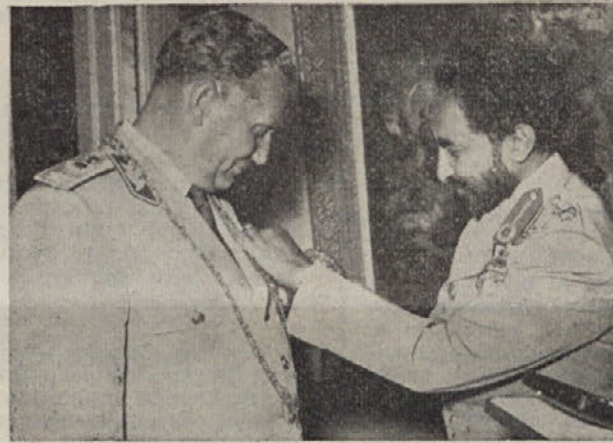
Srečanje dveh državnikov: Tito in etiopski cesar Haile Selasie