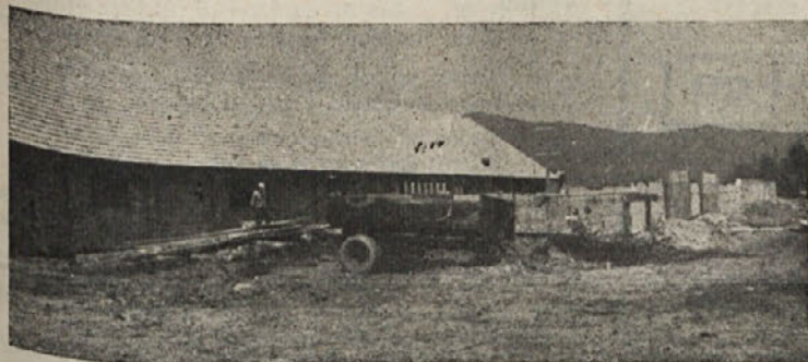
Nov hlev in silos na Ugarju bosta v kratkem gotova

vo. Ob robu gaja, v bližini ceste, sta zrasla dva velika, moderna hleva, med njima pa zidarji dokončujejo silos. Do kamor seže pogled se širi posestvo, tja do Bukovice in na jug proti Nemški vasi, proti Ribnici, ktere vršički zvonikov se vidijo iznad brega. Včasih pripelje po cesti, v oblakih prahu, traktor, živina v hlevih zamuka, teleta v starem hlevu vznemirjeno dvigajo glave, ko kdo vstopi, na koncu, v posebni pregradi, pa se živinorejec zaljubljen pogovarja z rjavim konjem, ga boža in mu poklada seno... F. G.