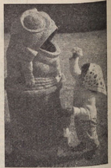
»Oh, revica, kako si lačna! Ti nihče ničesar ne da?«

Spet sem ga videla pred kinom. Vprašala sem ga, če mi bo kupil karto. Zmedel se je. Potem se je znašel in vzel denar. Nisem dolgo čakala, ko je prišel k meni in mi dal vstopnico. Hotel sem mu dati 20 din, kolikor mi je ostalo, a je že izginil. Nasmehnila sem se sama pri sebi: »Ubogi otrok, morda pa bo le postal dober!« Morda res ne bo nikoli več storil kaj podobnega, kot je napravil meni. Morda pa ga bo cesta, ki ima svoje življenje, zopet potegnila v svojo strugo... da