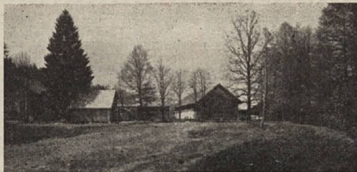
Kmetijsko posestvo Ugar pri Ribnici

Ko bosta dograjena oba hleva, bodo lahko redili na posestvu 500 glav živine, skupno s Sodražico pa 730 glav. Ena glavnih težav letos bo, tako pravijo, nakup živine za dopolnitev kapacit-