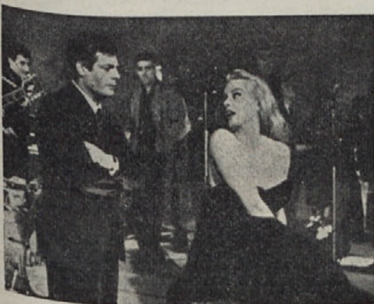
Marcello Mastroianni in Anita Ekberg v Fellinijevem »Sladkem življenju«