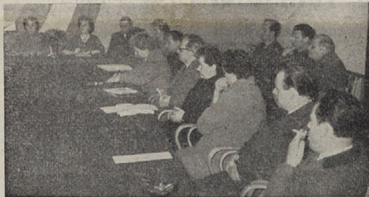
Med razpravo na obč. konferenci ZPM

V naši občini imamo nad 300 inženirjev in tehnikov, društvo ljudske tehnike pa kar ne more zaživeti, ker ne more dobiti — predsednika. Ljudska tehnika pa bi morala prav letos, ko poteka Jugoslovanske pionirske igre pod geslom »tehniko mladim«, voditi mlade in jim pomagati pri tehnični vzgoji.