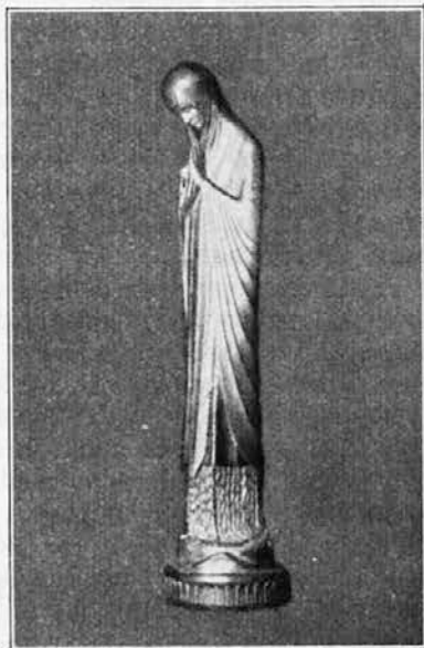
Beuron: Mati življenja

Mi stresamo vrata svetá, da sesuje trohnoba se vsa,