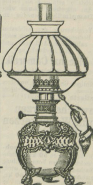
Tischlampe mit Brillant-Meteorbrenner.

Alle Glas-Erfordernisse für Petroleumlampen in reichster Auswahl.