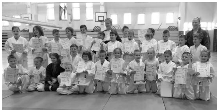
OŠ Destrnik-Trnovska vas

... V vseh teh situacijah je odvisen od lastnih odločitev in reakcij. Premagovanje nasprotnika, ovir, težav in lastnega strahu v judu lahko primerjamo s podobnimi situacijami v življenju. Dokazano je tudi, da se je šolski uspeh pri šoloobveznih otrocih, ki se ukvarjajo z judom, popravil za več kot 10 odstotkov – največji napredek so pokazali tisti, ki so še posebej izstopali pri vedenju (agresivnost, nedisciplinarnost, nezbranost ...). Zato v novem šolskem letu vabimo nove člane, da se nam pridružijo, vsem vam pa želimo prijetne počitnice, polne športa.