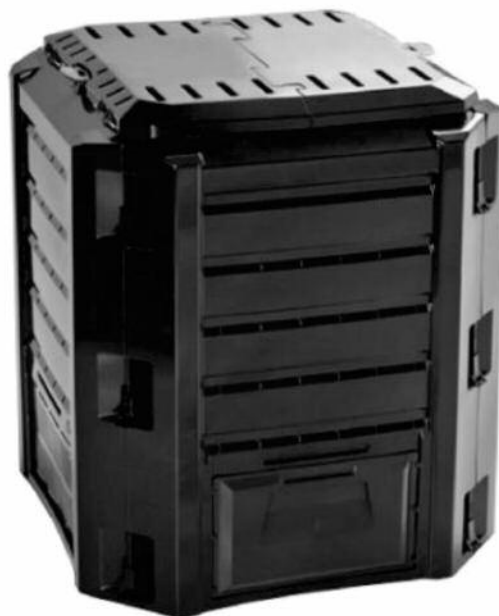
Slika 4: Kompostnik iz plastike

uporablamo posodico, ki jo običajno hranimo v kuhinjskem elementu ali shrambi.