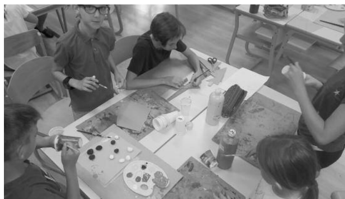
OŠ Destrnik - Trnovska vas