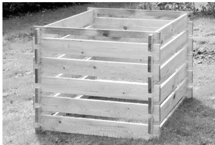
Slika 2: Kompostnik iz lesa