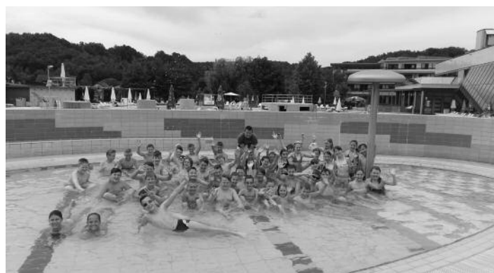
OŠ Destrnik - Trnovska vas