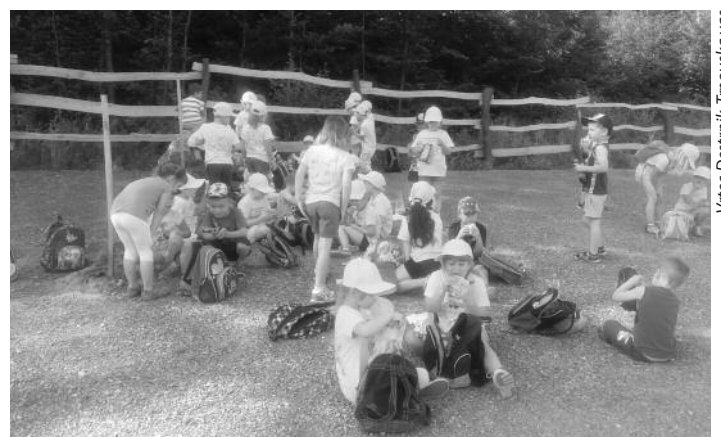
Vrtec Destrnik-Trnovska vas