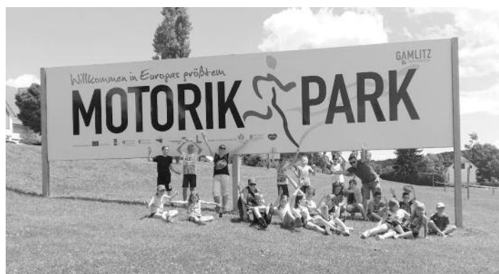
OŠ Destrnik - Trnovska vas

Učiteljice in učitelj OŠ Destrnik-Trnovska vas