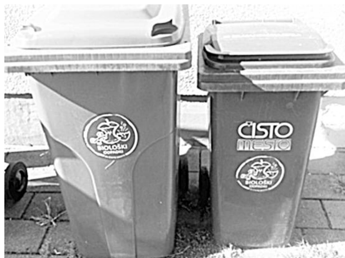
Slika 1: Tipski zabojnik za zbiranje biološko razgradljivih odpadkov

Biološko razgradljive kuhinjske odpadke je prepovedano rezati, drobiti ali mleti ter redčiti z namenom, da se jih z odpadno vodo odvaža v kanalizacijske sisteme, greznice, nepretočne greznice ali neposredno v vode. Povzročitelji biološko razgradljivih kuhinjskih odpadkov in zelenega vrtnega odpada morajo odpadke zbirati v vodotesnih zabojnikih, ločeno od drugih odpadkov, izvajalec javne službe zbiranja pa jih mora prevzeti s specialnimi vozili, ki preprečujejo izpuščanje v okolje ter ne povzročajo neprijetnih vonjav. Za zbiranje biološko razgradljivih kuhinjskih odpadkov