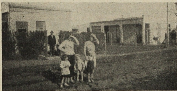
Pri Pertotovih in Biščanovih v Tolosi pri La Plati.