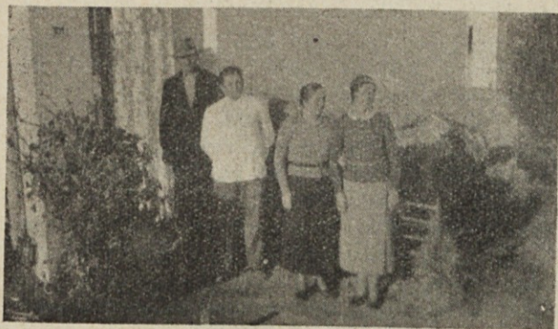
Pri Kovacičevih v Tolosi.

"Da, vidite. Dve leti je, ko sem prišel sem in hčer z menoj. Nekaj mojih je pa že dolgo časa tukaj.