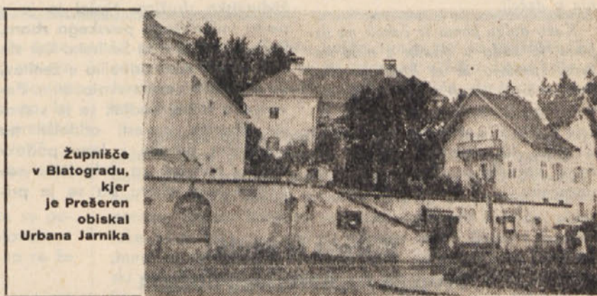
Župnišče v Blatogradu, kjer je Prešeren obiskal Urbana Jarnika