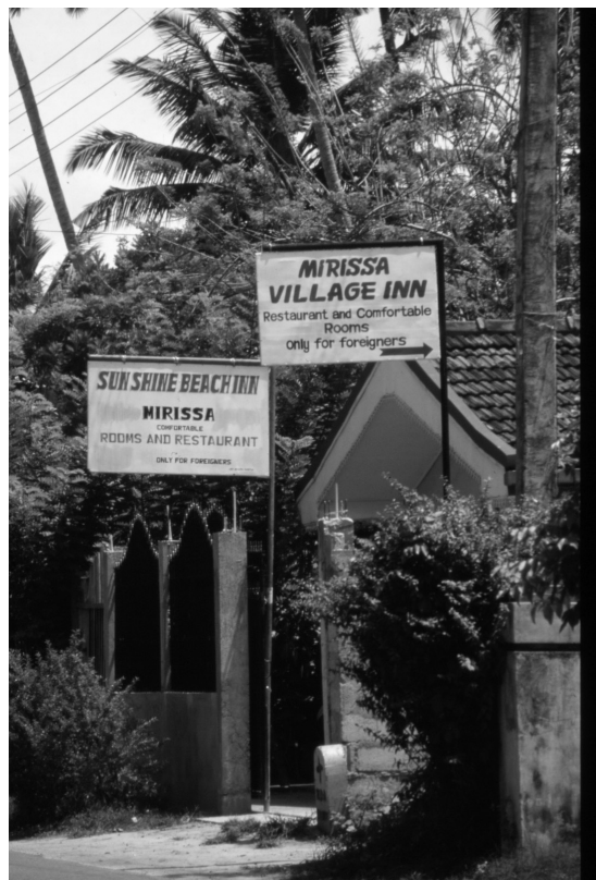
Fotografija 7: Table, ki opozarjajo, da so sobe na voljo »samo tujcem«, kar praktično pomeni, da domači turisti niso dobrodošli.