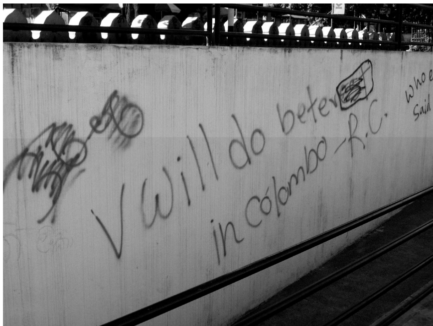
Fotografija 1: Grafita v šrilanškem mestu Kandy: »Bolje mi bo šlo v Colombu.«

Veliko moških se je ob tej situaciji začelo seliti v Colombo, kjer so si našli služabniška dela za zelo nizke plače, na čajne plantaže pa so se vračali le še ob večjih praznikih. Toda tudi tega si ni bilo vedno preprosto zagotoviti, saj so bili kot »Tamilci« zaradi etnične vojne v Colombu pogosto nepriljubljeni. Tako so številni ostajali ves čas brezposelni in ujeti na plantažah. Številne ženske so tako začele iskati še drugo službo, ki so jo zlahka našle v bližnjih tekstilnih tovarnah.