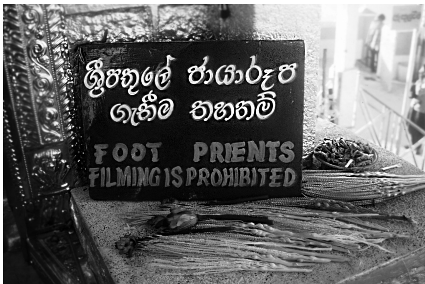
Fotografija 3: Adamov vrh (Sri Pada) – prepoved fotografiranja »odtisa« noge Bude ali Adama.

sedemdesetih letih vpletel tudi turizem. Znak vsaj delne turistične apropiacije so na primer vidna opozorila pred sicer »nacionalno-ljudskimi« templji, da je treba pred vstopom zakriti ramena in noge, v osrednje prostore templja pa vstopiti bos. Če stoji pred templjem znak s prekrizanimi golimi nogami in rameni, je jasno, da se je »svetemu prostoru« zgodila tudi druga spreobrnitev – tista, ki časti donacije turistov.