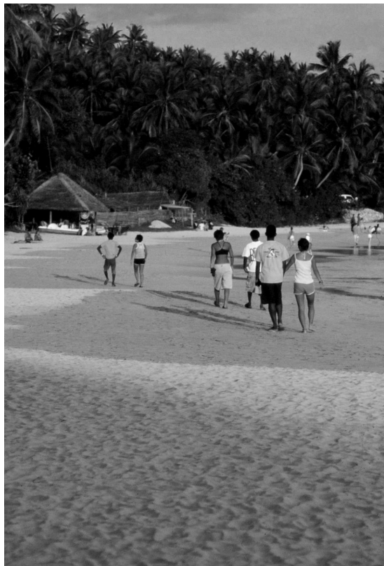
Fotografija 6: Lokalni mladci s turistkami na »svoji« plaži (angl. beach boys).

seveda problemi, katerih najslabši možni scenarij je pobeg dekleta k drugemu domačinu ali – pogosteje – v drugo skupino domačinov na isti plaži. Skupine se namreč navadno formirajo okoli posameznih, za tisto plažo bolj ali manj trendovskih restavracij, za katere »se med turisti ve«, saj so navadno to tudi prostori, kjer se med vikendi odvijajo zabave.