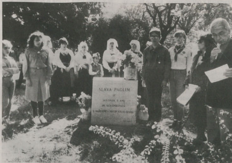
Ob 1. novembru so se Slovenci in vsi demokratični Tržačani poklonili spomenu padlih ob spomenikih. Pri Sv. Ani pa še vedno čakajo na spodobno ureditev spominskega parka.

Craxijev stavek bi bil vreden analize. Čemu množinsko izražanje? Mar je kdo hotel pogreti tezo, da nimamo opravka z dvema nacionalno in jezikovno enoviti-