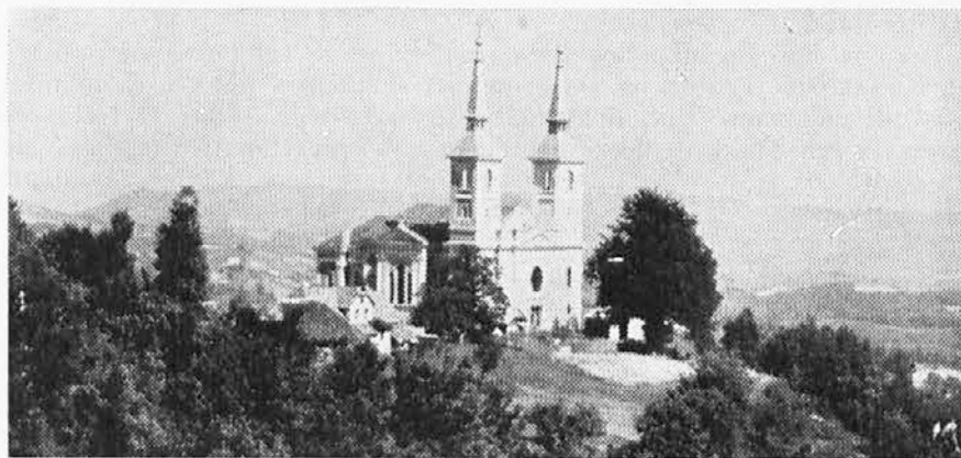
Zaplaz na Dolenjskem

Načrti za počitniška potovanja, taborjenja, Žingarico... Tako bogati so bili — pa so padli v vodo. Škoda brez dvoma! Toda kakšno korist so