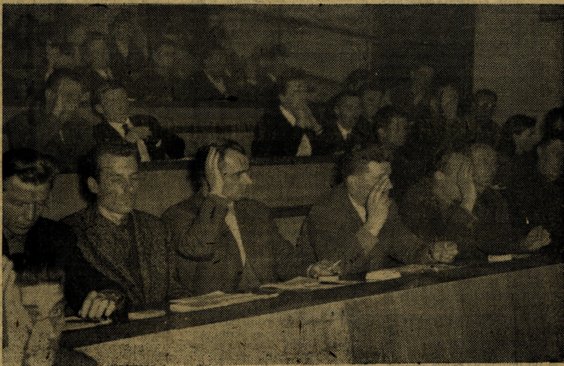
Centralni delavski svet na enem prejšnjih zasedanj

Dodatek za stalnost pri delu po tem členu se prične izplačevati delavcem na podlagi njihove izjave, da bodo po preteku petih let šli v pokoj bodisi na podlagi izpolnitve pogojev za polno osebno starostno pokoj (Nadaljevanje na 2. strani)