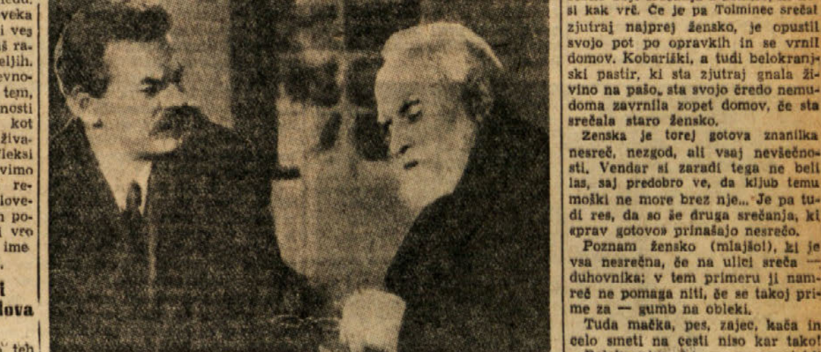
Ivan Petrovič Pavlov in Maksim Gorki se razgovarjata 1929. Na Levntov poziv se je podal Gorki do Pavlova ter mu je sporočil, da je sovjetska vlada pripravljena, da steri vse, da bo lahko Pavlov načeljeval svoja raziskovanja po najugodnejših pogojih.

Ze cedila slina samo ob pogledu. Tn veva pa ne samo za človeka in za psa nego vse živali in tudi ves človeški način mišljenja, ves naš razum je sgrajen na teh temeljih. Razlika med človekovo edusvevstjo in razumom je samo v tem, da ima človek mnogo več možnosti za razvoj pogojnih refleksij, kot jih imajo živali.