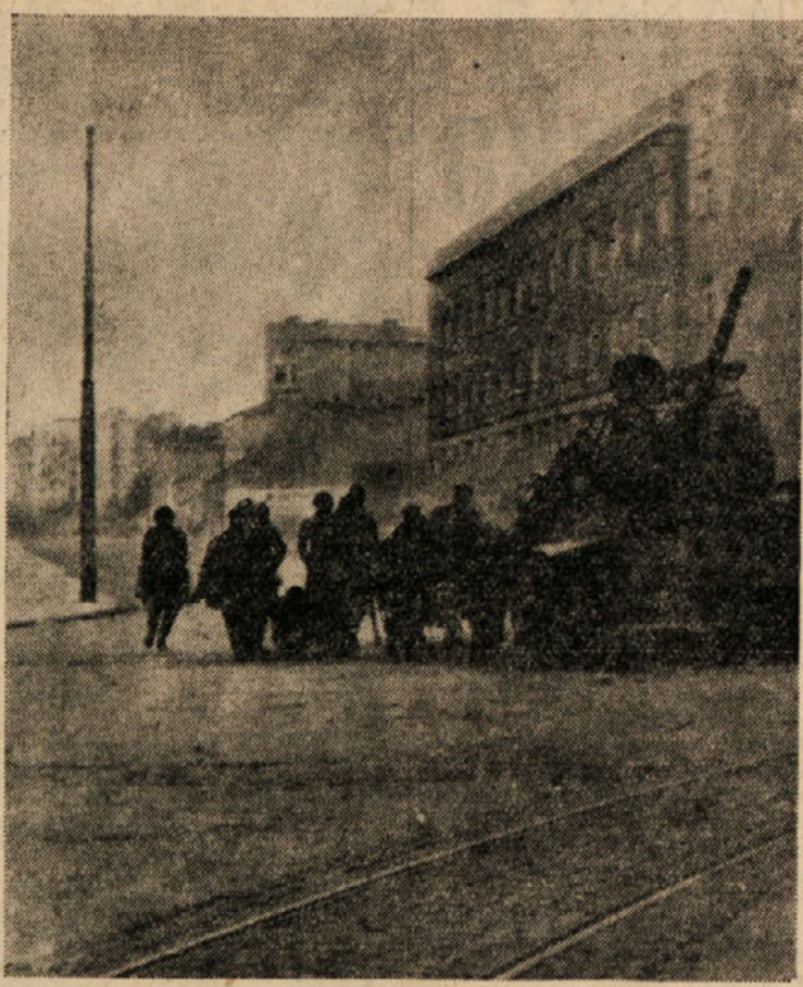
Pod zaščito sovjetskih tankov so prenašali tekom beograjskih borb (1944.) ranjene iz prednjih položajev. Sovjetska pehota, topništvo in tanki so bili tista udarna pest, ki je osvobodila s pomočjo partizanske vojske Beograd izpod nacističnega suženstva in ki je za ceno lastnih žrtv preprečila večja razdejavanja v mestu

27. marca 1941. so stopile delovne množice na ulice Beograda pod geslom: »Zahtevamo pakt o medsebojni pomoči s Sovjetsko zvezo.« To geslo je bilo na lepkih, ki so jih nosile množice v Beogradu. To geslo je predstavljalo konec protislovenske in protijudske politike in uresničenje stoletnih sanj jugoslovenskih narodov: Naslonitev na Sovjetsko zvezo, kij e najtrdnjaja opora malih narodov. Beograjski puč je uvod v veliko narodno-svobodilno borbo proti okupatorju, saj se je vršil tudi pod geslom: Bolje rat (vojna), nego pakt.