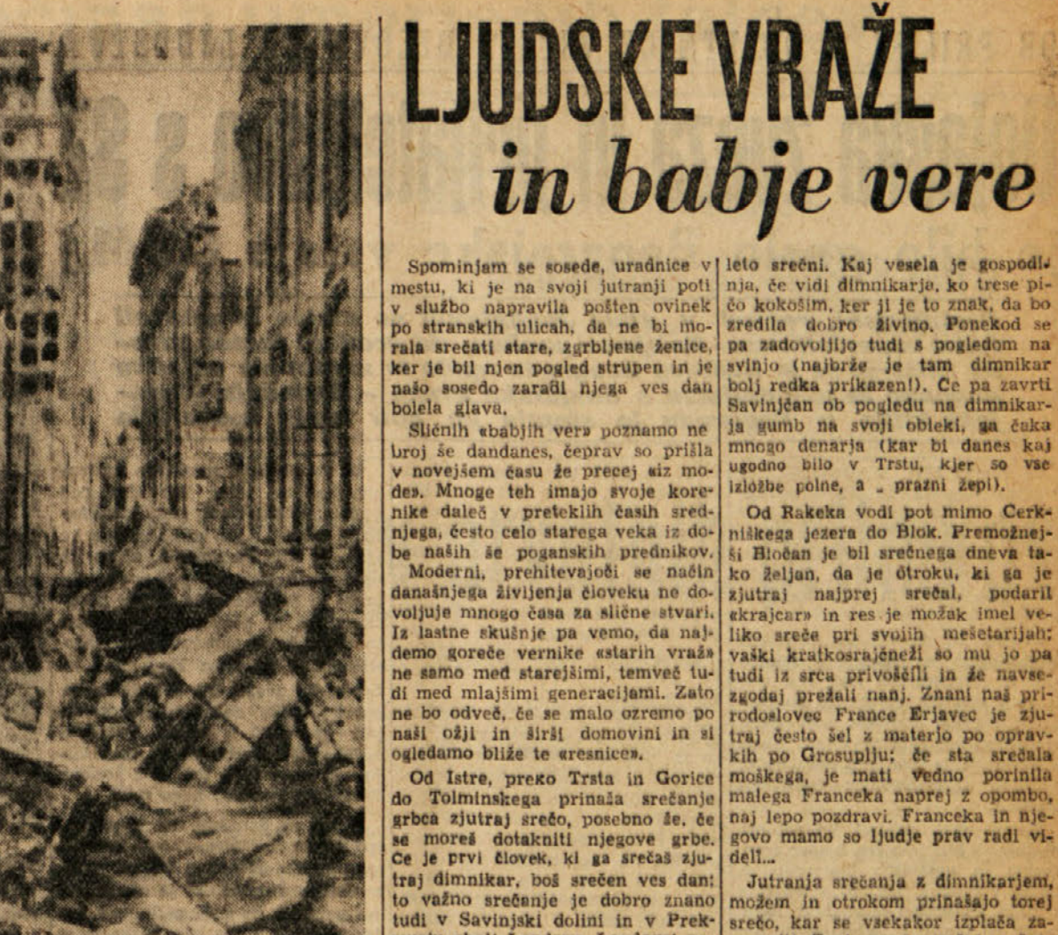
Varšava takoj po osvoboditvi. Le redke so bile zgradbe in ulice v Varšavi, ki so ostale v boljšem stanju, kot ga vidimo na sliki. Uničenja so bila posledica nemškega terorja proti vstaji ljudskih množic v Varšavi