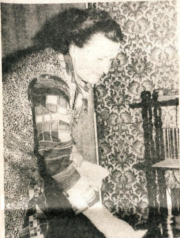
»Danes sem zadovoljna, želim si le več zdravja.«