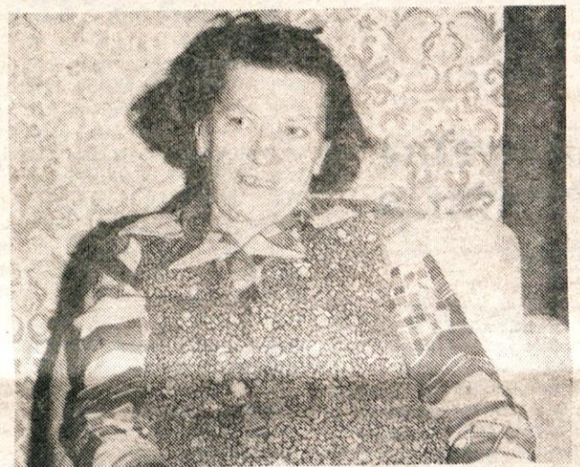
»Veliko dogodkov iz NOB sem si tudi zabeležila.«