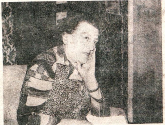
»Pot do svobode je bila trnova in krvava.«

Prvih šest dni smo prebili v bunkerju, od koder so nas vlačili po zasliševanjih. Tepli so nas, mučili na vse mogoče načine, da bi v nas umorili Slovence - slovenski narod. Po grozotnih mučenjih so ugotovili, da nočem ničesar izdati, zato so me nagnali na prisilno delo. Takrat pa sem začela premišljati, da me lahko odpeljejo na morišče ali pa v taborišče. Zato sem sklenila, da pobegnem.