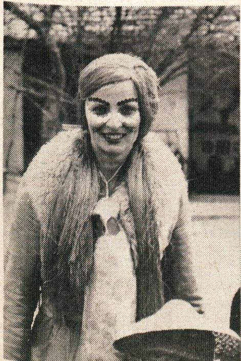
Naša tovarišica je dobra princeska iz pravljice, mi pa smo njeni ubogljivi palčki.

Na pustni tork so tudi letos oživele kamniške ulice v pisanem sprevodu najrazličnejših mask. Že dopoldne je bilo zelo živahno, saj so se po mestu sprehajali kavboji, indijanci, mačke, miške, princese in druge domiselne maske iz kamniškega vrtca. Ljudje so se ustavljali in jih občudovali, malčki pa so ponosno stopali v svojih preoblekah in mahali v pozdrav. Vsaj en dan v letu so se jim izpolnile želje, da postanejo tisto, kar so si na tihem že dolgo želeli postati.