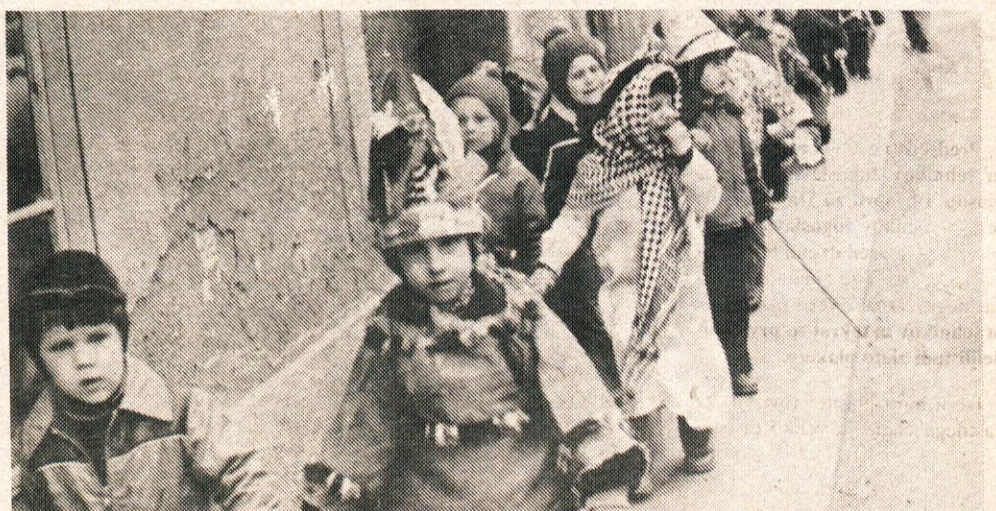
Sedaj se nam pa že zelo mudi v vrtcu. Tam nas čakajo veliki sladki krofi.