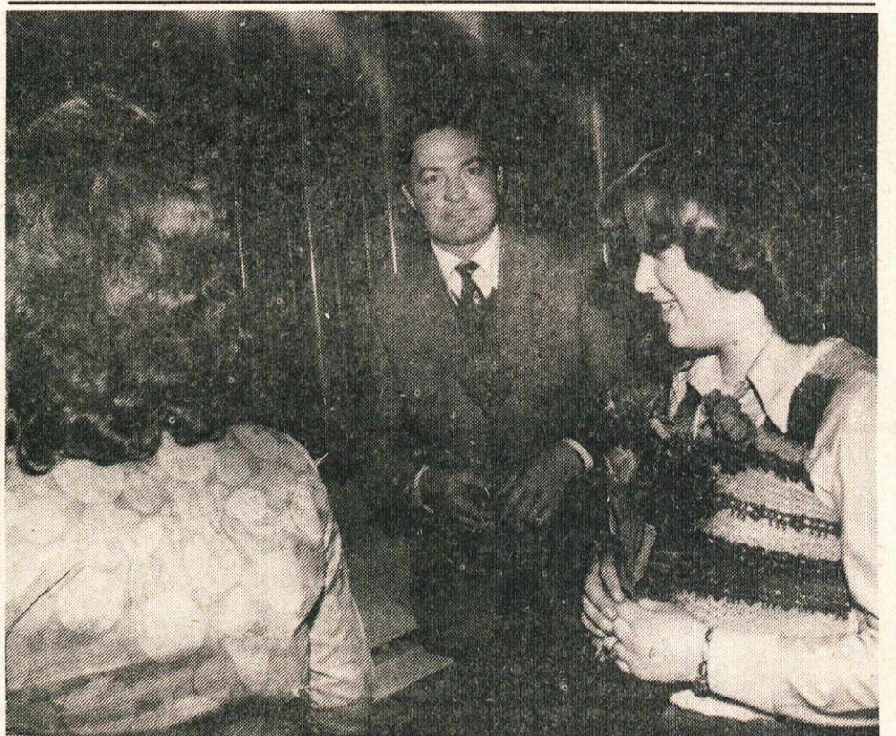
8. marec – Iskren stisk roke, iz srca poklonjen šopek cvetja ob prazniku žena lahko pomeni veliko, mnogo več od bogatega darila brez iskrenih medsebojnih odnosov.