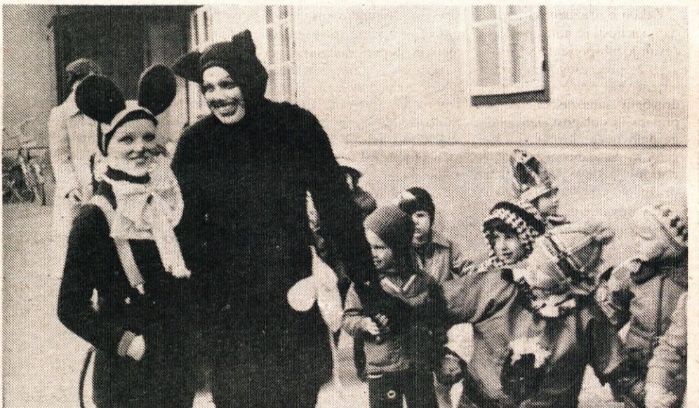
Oh, ko bi bile naše tovarišice vedno tako lepe miške in mucke, to bi se igrali z njimi in jih cukali za rep.