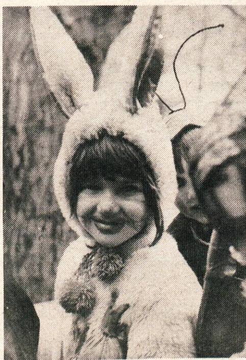
Danes sem beli zajček in nihče me ne bo pregnal iz mojega zeljnika.