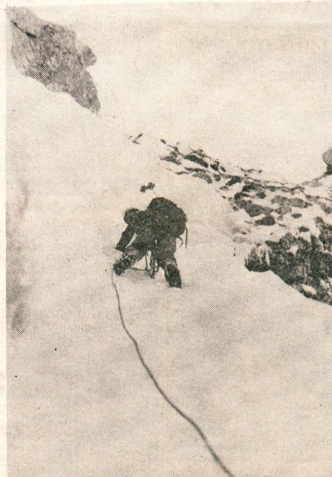
Zima ima svoje čare in pasti.