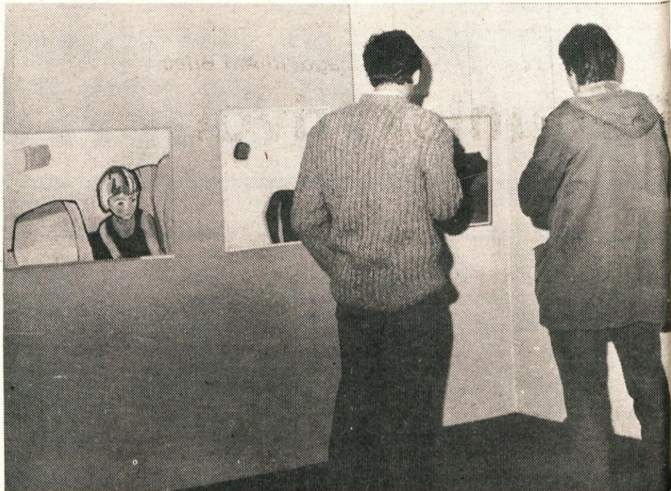
OB 750-LETNICI KAMNIKA