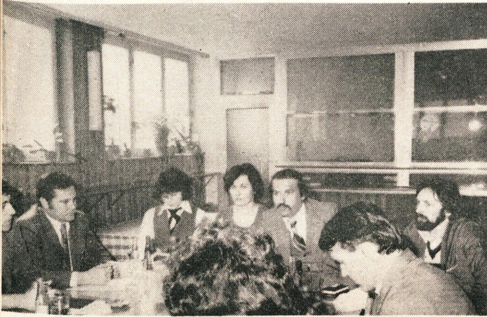
Tudi v Svilanitu posvečajo veliko pozornosti ženam proizvajalkam.

● V Svilanitu o položaju delavke v združenem delu