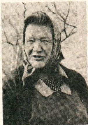
»Najhuje mi je bilo, ko so mi vzeli vse otroke.«

Ob košnji otave so imeli moj mož in še nekateri drugi tovariši sestanek na travniku pod hišo. Otroke sem poslala na stražo in rekla, naj takoj pritečejo povedat, če bodo videli žandarje. Toda otroci so to storili šele, ko so bili žandarji že zelo blizu. Pritekli so povedat, tako da so se drugi še pravi čas skrili, mene pa so aretirali in me boso, kakršna sem bila na travniku,