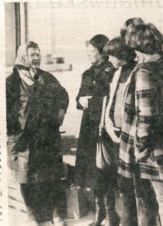
»Vesela sem vsakega obiska. Le pridite še kaj.«