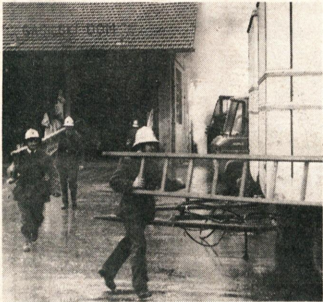
V akciji »Nič nas ne sme presenetiti« bomo letos preverjali naše znanje s področja družbene samozaščite.

Glede na to, da časa ni na pretek, bo potrebno zastaviti vse sile, da bo akcija »Nič nas ne sme presenetiti« dosegla svoj namen v organiziranju delovnih ljudi in občanov v družbeno samozaščiti kot množičnem temelju obrambne pripravljenosti.