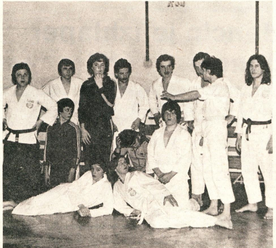
Karateisti iz Komende.

S pripravljalnimi deli bo izvajalec gradbenih del pričel te dni. Glede na prizadevnost izvajalcev, investitorja in gradbenega odbora v pripravljalnem obdobju, morajo biti dela izvedena do predvidenega roka. J. MALEŠ