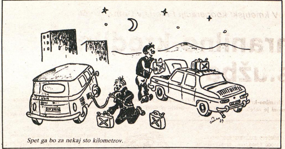
Spet ga bo za nekaj sto kilometrov.

V obravnavanem obdobju so bile na vrsti tatvine raznega materiala in artiklov. Lastnike so zamenjali mopedi, pony expresi, denar, zapestnica, smuči, litri bencina idr. Na delu je skupina