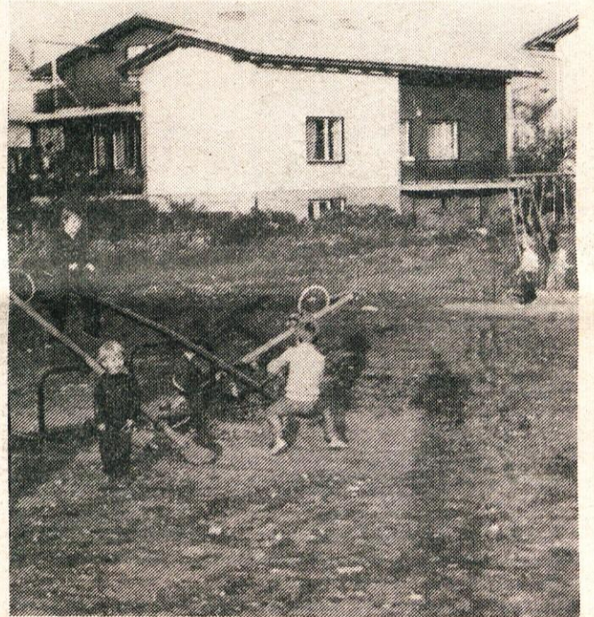
Pomlad prihaja in tudi otroška igrišča so že oživila. Vendar to še ne pomeni popolnega veselja naših najmlajših, saj so nekatera igrišča v Kamniku že dolgo razdejana in zanemarjena. Polomljene gugalnice, tobogani in druga igrala večkrat izzovejo nesrečo, da o onesnaženosti niti ne govorimo. Verjetno bodo marsikje morale krajevne skupnosti stopiti v stik s hišnimi sveti in čim prej izpeljati akcije pri urejanju otroških igrišč. V letu otroka smo še predvsem dolžni take pomanjkljivosti odpraviti.

Z zaključkom kandidacijskega postopka je delo Socialistične zveze končano, kajti nadaljnji postopek, ko je kandidat dobil podporo na občinski kandidacijski konferenci, prevzame občinska skupščina, ki bo lahko že na svoji aprilski seji izvedla volitve.