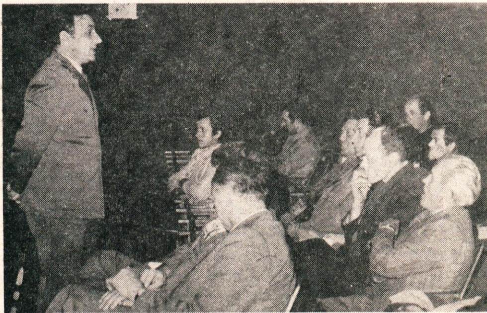
V okviru rednega programa usposabljanja članov zveze rezervnih vojaških starešin, so te dni v vseh devetih osnovnih organizacijah ZRVS v kamniški občini predavanja. Na njih rezervni oficirji pridobivajo znanje, ki je nujno potrebno za njihovo delovanje v vseh oblikah družbene samozaščite. Predavanjem, ki so dobro obiskana, bodo sledili taktični pohodi in seveda vsakoletno preverjanje znanja.