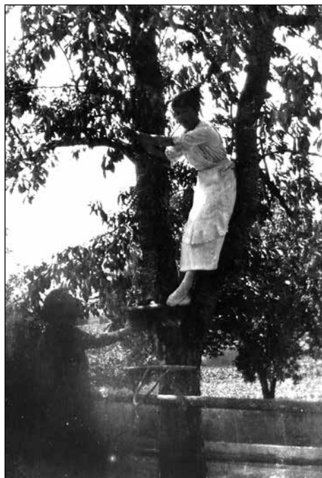
Micika na češnji.

podobo Človeka, zato so še toliko bolj dragocene.