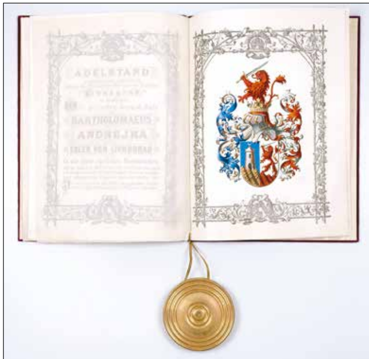
Grb družine Andrejka. Po očetu Jerneju Andrejki je družina pridobila naziv plemeniti Livnogradski.