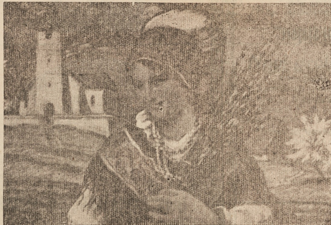
Veselo Veliko noč vsem rojakom in rojakinjam, posebej pa vsem svojim sodelavcem!