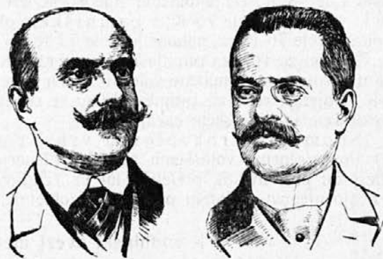
Finančni minister Caillaux. Gaston Calmette †.

K umoru urednika lista „Figaro“, ki ga je izvršila žena francoskega finančnega ministra.