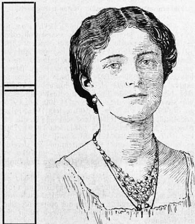
Ruska velika kneginja Olga.