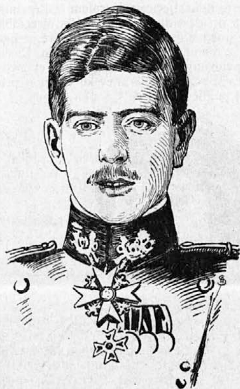
Rumunski kraljevič Karol.