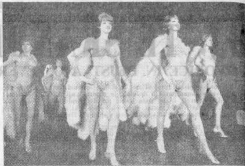
FRANCIJA SLOVI PO MARSICEM, A KADARKOLI KDO PRIPOVEDUJE O NJEJ, MORA GOVORITI O PARIZU, MONTMARTURU, PIGALLU IN O ZABAVISCIH, KI SLOVIJO PREDVSEM PO LEPOTICAH. NA SLIKI SO DEKLETA »BLUEBELLS« IZ PARISKEGA LIDA. ZA VSE TO SE FRANCOZI OPRAVICUJEJO S PREGOVOROM: DOVOLJENO JE, KAR UGAJA!

Najbolj ga je pri njegovi odrasli hčerki morilo obnašanje, nad katerim je bil tako vžičen pri svoji sekretarki.