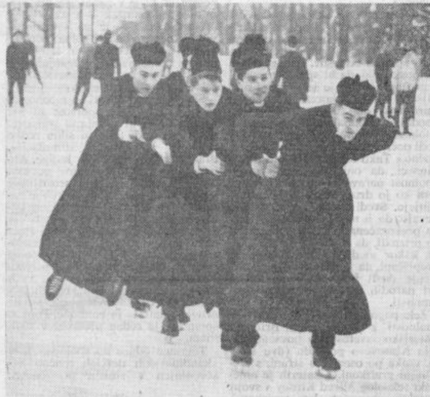
REDOVNIKI IZ KOLEGIJA USHAW V ANGLIJI SKRBIJO ZA TELESNO REKREACIJO. DA BI BILI NA LEDU STABILNEJSI, LOVIJO RAVNOTEZJE, KOT VIDIMO, Z ZDRUZENIMI MOCMI, SEVEDA VCASIH SKUPAJ PADEJO IN JE TUDI BOLECINA SKUPNA.

KUPON ST. 54 TOCKE (od 0 do 100) Izrežite, nalepite na dopisnico in pošljite na naslov: Uredništvo Celjski tednik, Celje, Gledališka 2, poštni predal 161.