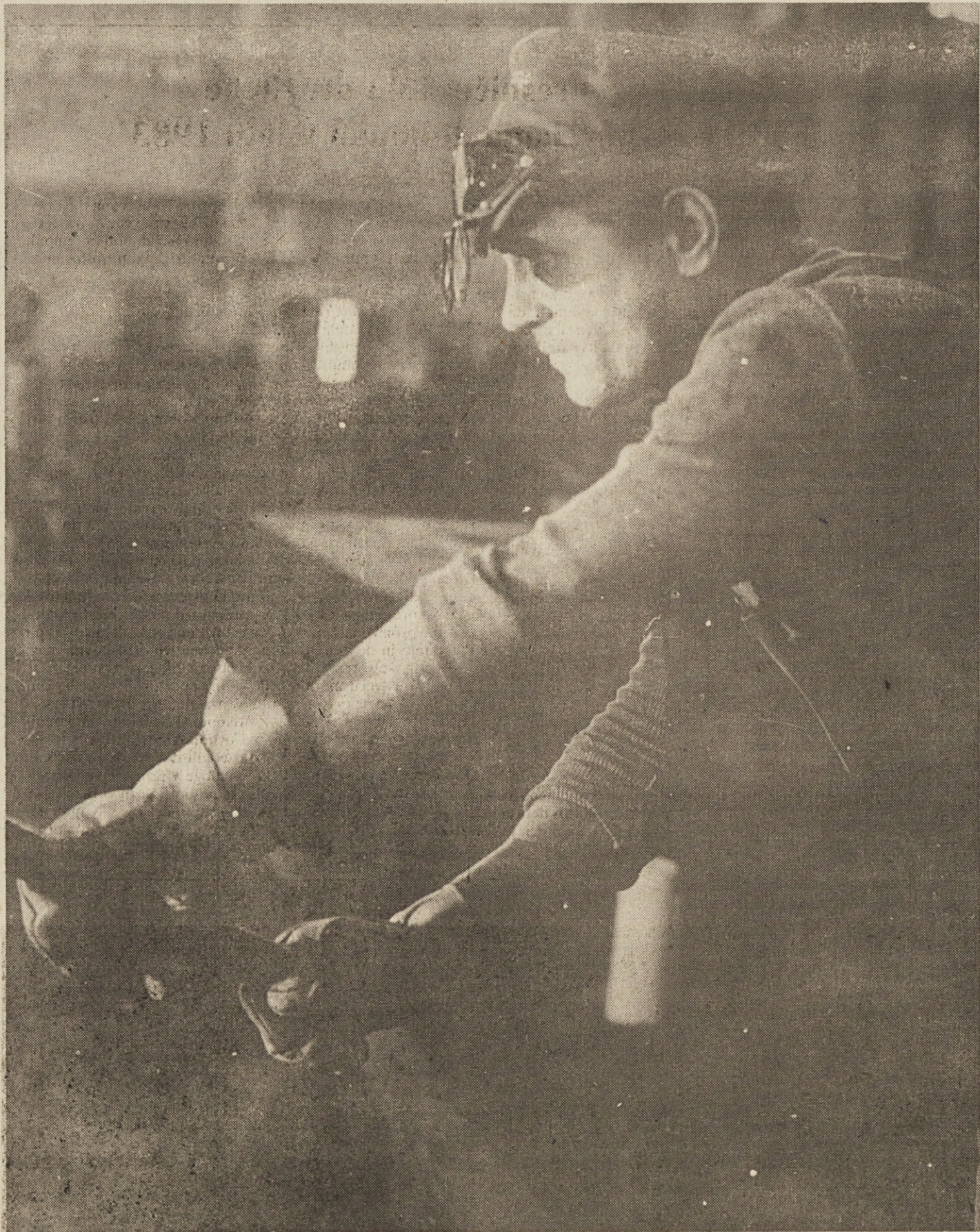
Sindikalni poročevalce je uredil Peter Štefanič. Tehnični urednik Franc Mulec.