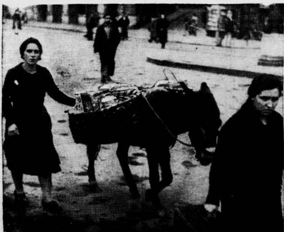
Rosnetek iz okolice Bilbao. Kmetice z živili na poti v mesto