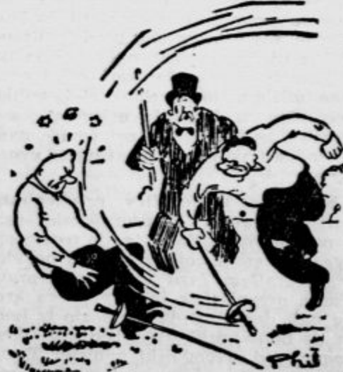
»Stoj! Udarci z ročajem floreta ni dovoljen!«