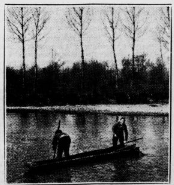
Čolnarja sta iskala ponesrečenca

V zlih slutnjah so ga domači začeli že na vse zgodaj, ko se je komaj jelo daniti, iskati po strugi Ljubljance. Kmalu so se jim pridružili še požrtvovalni fantje, ki so v čolnu z velikim trudom preiskovali vse tolmune in vrtnice po vsej strugi od Zavoglja do kašeljskega mosta, zakaj radi bi vrnili nesrečni družini ljubljenega očeta vsaj mrtvega, da ne bi bili tako na mah za vedno oropani najdražjega, kakor so bili njihovi strici in tete, ko jim je Sava — vsaj tako sodijo — ugrabila doli