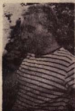
Mojster Tavernari v urici oddiha

prefinjene, včasih že kar rafinirane linije, ki jih odkrije šele svetloba, padajoča na skulpturo pod premišljenimi koti. Zdaj je prišel v atelje na prostem, ustvarjal je v spreminjajoči se svetlobi, v večji razsežnosti, kot je vajen v ateljeju. Vse to ga je sprva motilo in je zato delal vsak dan ob določeni uri, ko je bila svetloba približno enaka. To mu je uspelo prilagoditi njegovim navadam in