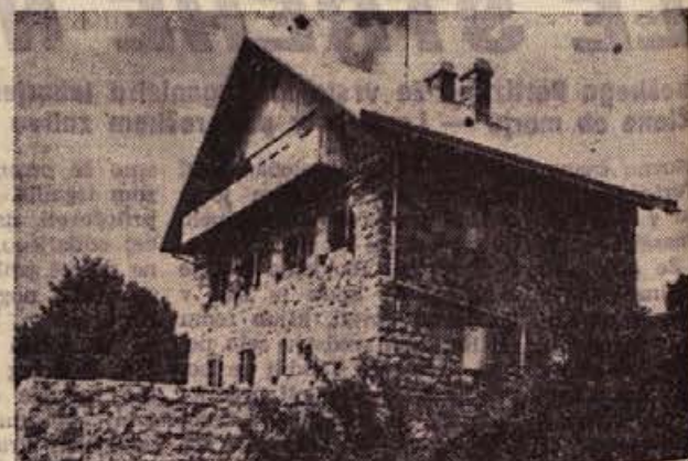
Planinsko srečanje na Mirni gori

leve, in oblastnim organom, ki naj bi upošteval koristne pobude državljanov. Seznanjanje pa tudi odpravlja pomanjkljivost v dosedanjih praksi, češ da so oblastni organi eno, politični organi pa drugo. Prizadevanje, da bi čimprej dosegli napredek, ne bo neplodno, zlasti ne, če bodo tudi občani vedeli, za kaj gre, kje je treba popustiti in kje pomagati.