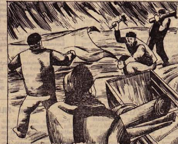
47. Našli so pripravno mesto in postavili sotor. V led so naredili zaseko, kamor so spravili čoln. Zeleli so si edinole to, da bi kmalu dospeli v Dawson. Čok pa je vsakih pet minut zagrmel prvo kitico neke bojne pesmi.