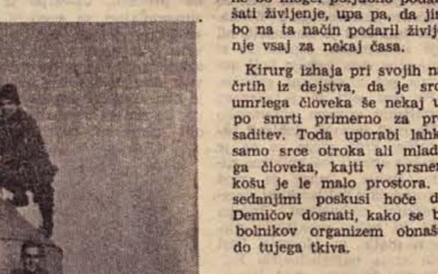
Sest »kranjskih Janezov«, ki so kot vojaki in hkrati turisti obiskali pred kratkim vrh Triglava, skalno strmo naše domovine, pošila lepe planzanske pozdrave bralecem Dolenjskega lista! — Na sliki: naši bralec in prijatelj ob (in na) Aljaževem stolpu vrh Triglava

Človek z dvema srcema? (Continuation of the article about the heart transplant experiment on a dog.)