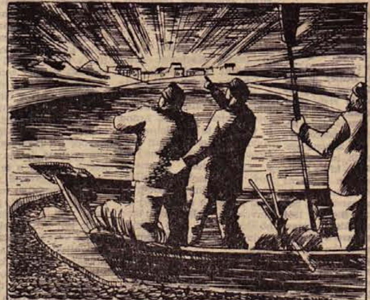
48. S težavo so čoln zrinili proti deročemu rečnemu toku. Zmrzvalo je in čoln je postajal jedro ledenega splava. Vse je škripalo, ko so pluli po Yukonu. Ko se je znočilo, niso mogli k obali. Na bregu so zagledali luč in splav se je ustavlil ob ledenih ploščah. Yukon je za šest mesecev zamrznil!