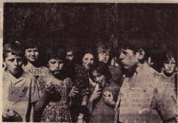
Takole se jim je godilo med sladko malico...