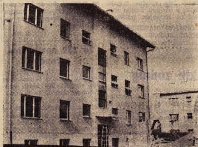
Zadnja dela na novem 9-stanovanjskem bloku ob Trdinovi cesti; še nekaj dni, pa bo selitev...

Letos bodo pridelali v Borsni in Hercegovini okrog 20.000 metrskih stotov pšenice, kar je v primerjavi z letom 1959. Ko je bila izredno bogata letina, za 5.000 metrskih stotov manj. Kmetijska posestva so pridelala okrog 30 metrskih stotov na hektar, ponekod tudi 40, pridelavec pogodbene pšenice pa se giblje od 13 do 25 metrskih stotov.