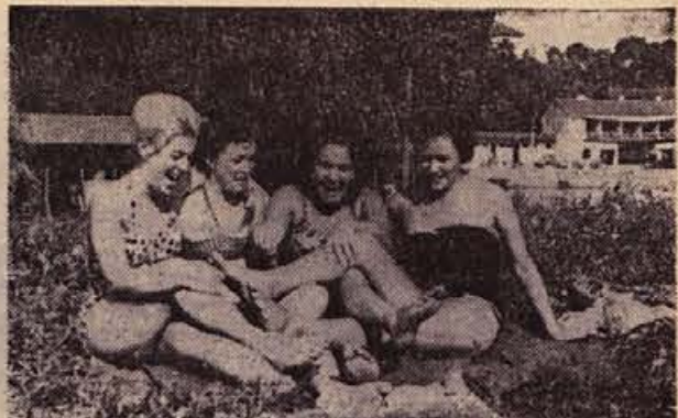
Onstran Krke — na dosegednjem letnem kopalšču, ki pa je žal letos uničeno in neuporabno! — je dolčas in pristop v reko skorajda nevaren za življenje. Zato pa je na desnem bregu letos tolikanj bolj živahno. V nedeljo popoldne je bil tu živ-ziv kot že dolgo ne, saj je vse hilelo k vodam in v senco sprlo prave letne vročine, kakršne smo se skoraj odvadili. Tudi naše širi znanke so si prilivošile na obljudenem travniku prijeten odih, čeprav bi se jim pri tem »skoraj zmešale noge«. No, pri 35 stopinjah Celzija po navadi nismo preveč resni...

V Mirenski dolini je potok Mirna, ki ima precej