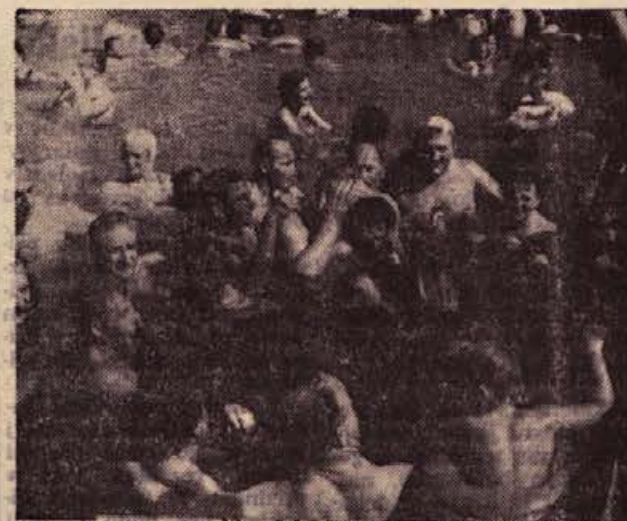
Tudi tole je turizem, pa še prav prijeten in zabaven: če nam je v polnem bazenu kopališča v Dol. Toplicah le še prevroče, si lahko pomagamo po domače — s pletenko dobre pijače...

Takoj po ustanovitvi so pričeli graditi gasilski dom, ki je bil ob močni podpori prebivalstva dograjen drugo leto. To leto so kupili tudi prvo motorno brizgalno, ki jih še