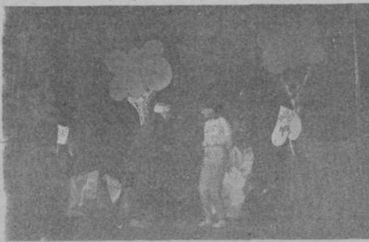
Dramska skupina OŠ Šmarje je navdušila z odlomkom iz igrice MEDVED PU IN NJEGOV PRIJATELJI.

Vse prireditve so bile dobro obiskane, kar dokazuje, da je šlo za dobro sodelovanje ZKO Grosuplje in šol v krajih, kjer so bile revije. Posebno pohvalna je udeležba nastopajočih s šol, saj so se revij udeležile domala vse šole v naši občini.