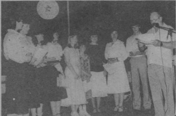
Nastopajoči prejemajo nagrade in diplome za dosežena prva (do peta) mesta