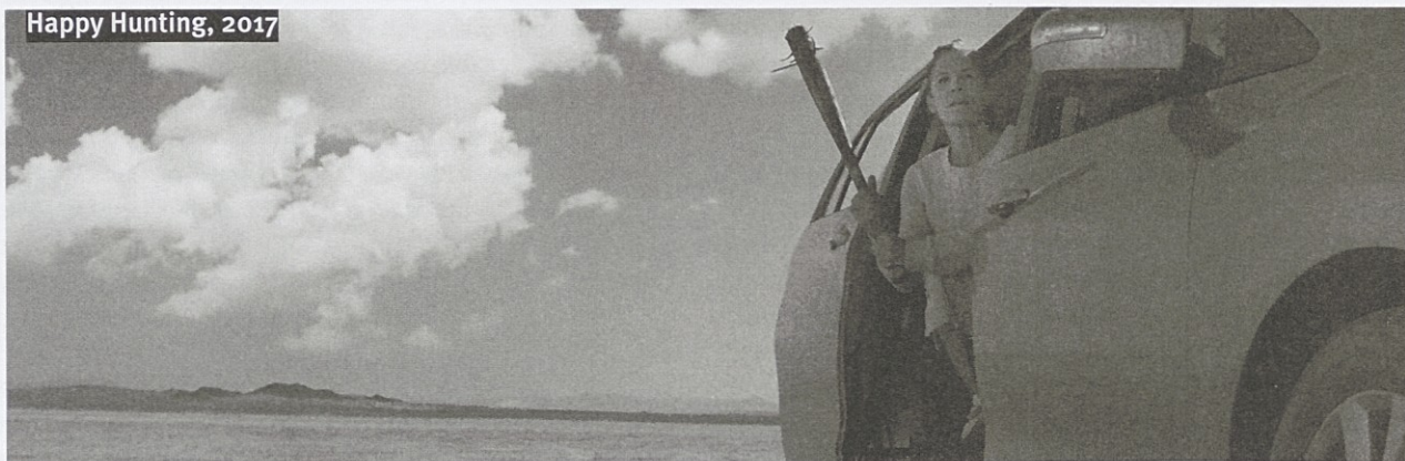
Happy Hunting, 2017

Koliko lahko tak pristop prispeva k naši filmski sceni, pokažimo na primeru trojice letošnjih filmov. Zmagovalec letošnjega tekmovalnega programa, Noč device (La noche del virgen, 2016), je celovečerni prvenec španskega režiserja Roberta San Sebastiána. Začne se s komičnim televizijskim prizorom dveh voditeljev, ki gledalce španske televizije uvedeta v prenos kičastega praznovanja novega leta, a se jima ne ljubi slediti scenariju in z različnimi opazkami drug drugega spravljata v zadrego. Gre za zabaven in zelo posrečen uvod, ki gledalca pripelje do osrednje zgodbe, v kateri spremljamo 20-letnega Nica (Javier Bódalo); ta med novoletnim žuranjem sreča privlačno, a starejšo Medeo (Miriam Martín), ki ga zvabi v svoje stanovanje, kjer se začne festival skrajnega gravža prek fizičnega mučenja mladeniča. Film svoj nizki proračun v slogu opisanih prijemov rešuje z enotnostjo dogajanja, a ga dobra fotografija, kredibilen scenarij in povsem solidna izvedba maske in posebnih učinkov naredi za zasluženega zmagovalca letošnjega festivala. Gre preprosto za idealen tip izdelka za zastavonošo Grossmannovega programskega dela: nekoliko obskuren žanrski film, ki je sicer nizkopračunski, a vseeno dovolj prepričljiv, da gledalcem predstavi neko povsem nevidno žanrsko nišo.