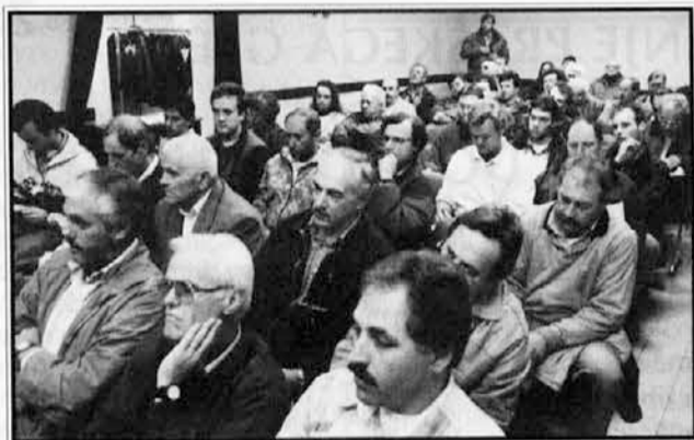
Večera se je udeležilo veliko število ljudi.

V četrtek, 7. t.m., so Agrarna skupnost jusov - srenje v tržaški pokrajini, Srenje - vicinije iz Kanalske doline in Agrarna skupnost iz Slovenije priredile v kulturnem domu na Colu okroglo mizo na temo Srenje v deželi Furlaniji-Juljski krajini - Evropska listina, edino učinkovito sredstvo za razvoj in ohranitev teritorija.