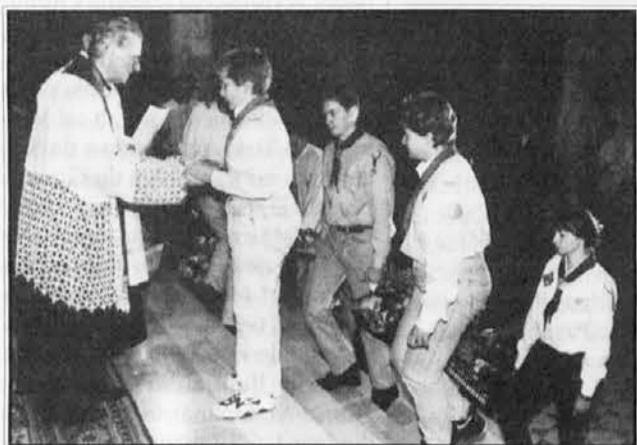
Skavti prinašajo darove na oltar.