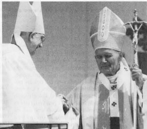
Dva velika zlatomašnika, dva velika pastirja