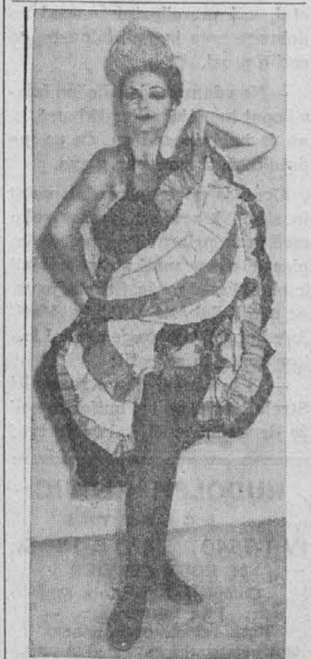
CAPTIVATING CAN CAN girl is Mary Ellen Moylan, prima ballerina of the Metropolitan Opera Company, currently appearing at MusicArts tonight through Sunday, August 12, as the dance star of the tent theater's rollicking revival of "The Merry Widow," and of the following production, Bizet's immortal opera "Carmen," opening on Monday, August 13, and starring Beverly Sills, prima donna of the New York City Opera, in the title role.

Elektronska naprava pa pokaže tudi to, da so napete vse mišice določenega dela telesa, ki opravlja ta ali oni delovni proces, kadar dela delavec z voljo in s poletom. Tako lahko te naprave "izmerijo" tudi razpoloženje delavca za to ali ono delo.