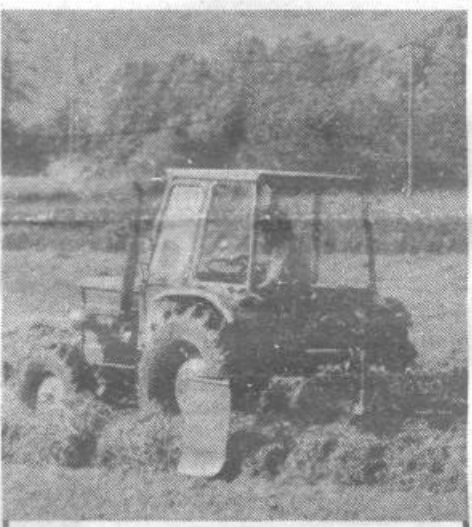
Pa vendarle, poletje se bo le pričelo.

Pri predvidenih naložbah prihaja do časovnih zamikov, kar zlasti velja za načrtovano gradnjo v zasebnem sektorju drobnega gospodarstva. V trgovini kaže, da so bila načrtovanja realna in bo možno z izgradnjo novih trgovin izboljšati oskrbo v občini. V kmetijstvu vnaša negotovost neustrezna cenovna politika, ki ob pomanjkanju realnih in z vsemi ekonomskimi ukrepi podprtih ekonomskih odločitev izničuje pozitivne učinke melioracij zemljišč, posodabljanja mehanizacije in uvajanja novih strokovnih spoznanj v živinoreji in kmetijstvu.