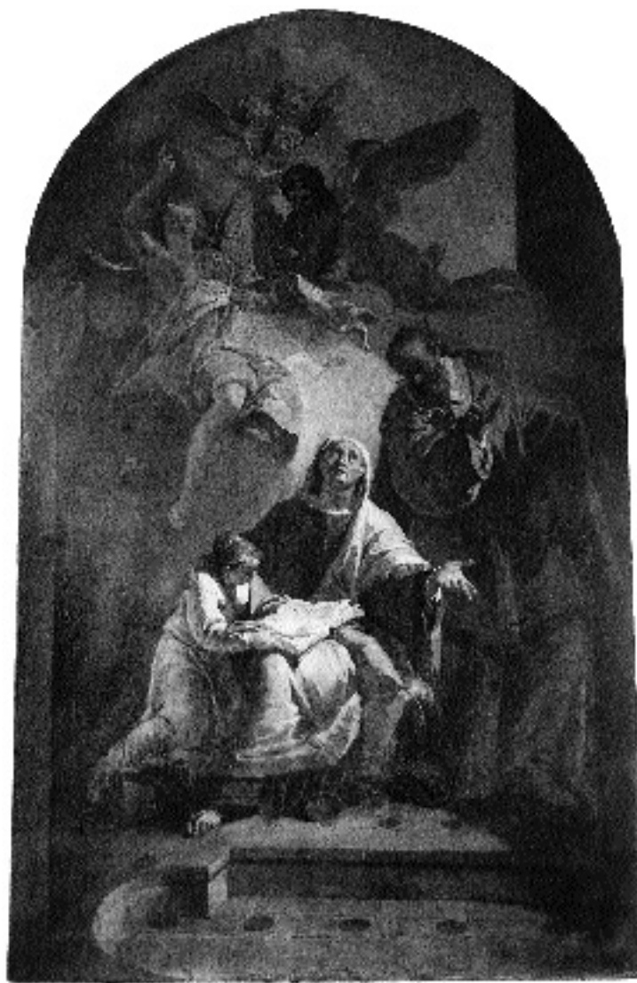
3. Francesco Fontebasso, Sv. Ana uči Marijo brati, Sv. Duh pri Škofji Loki, Ajmanov grad (posnetek iz leta 2001)