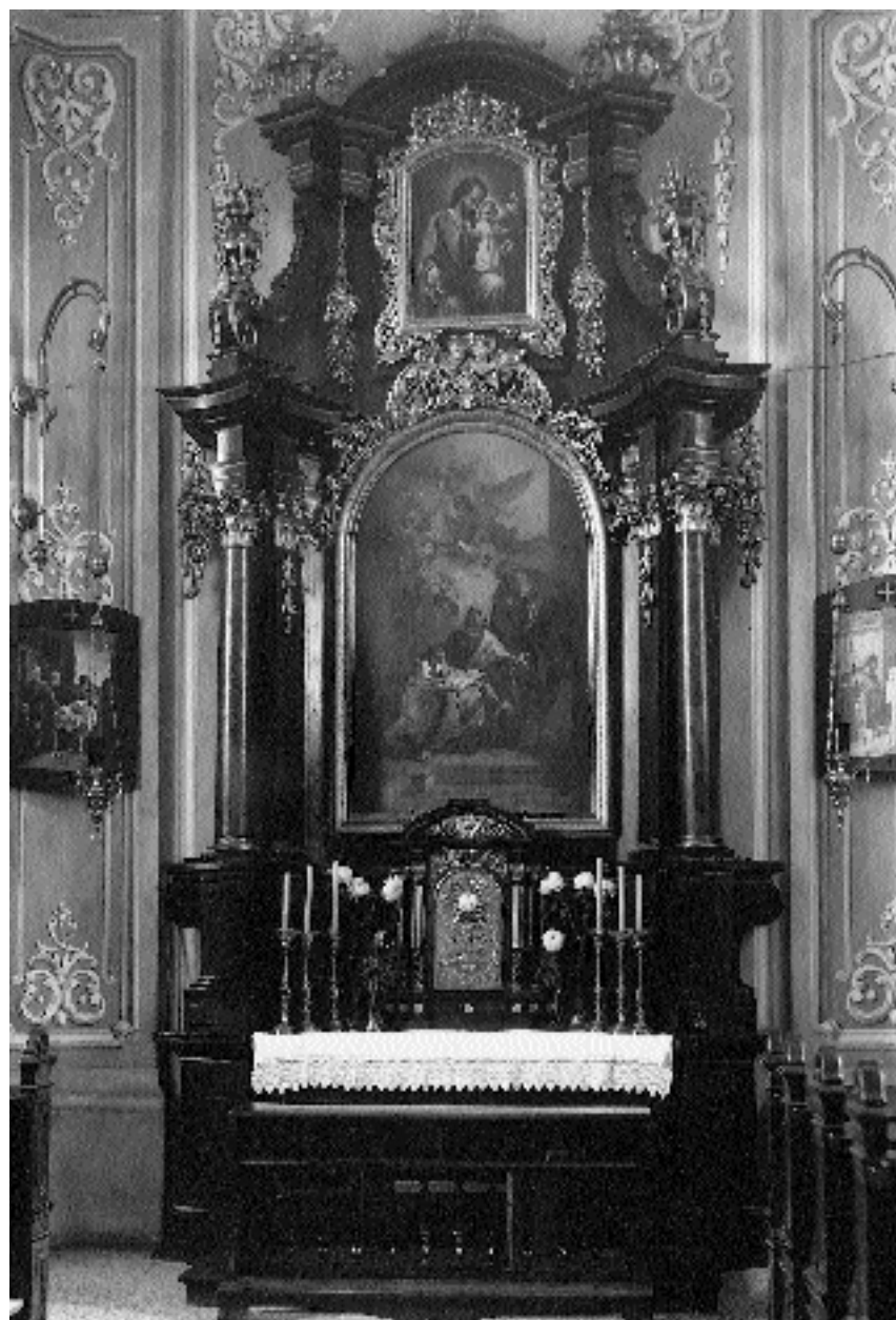
1. Veliki oltar, Škofja Loka, grad, kapela (uničeno; posnetek iz o. 1938)