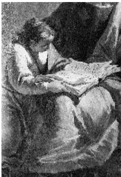
4. Francesco Fontebasso, Sv. Ana uči Marijo brati (izrez), Sv. Duh pri Škofji Loki, Ajmanov grad (posnetek iz leta 2001)