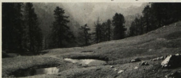
Čudovita narava na Slemenu

nemo na stezo, ki se v okljukih strmo vije na sedlo Vratice (1807 m). Na poti proti Vratice se nam pridruži steza od malo nižje ležeče Erjavčeve kočice (1515 m). S sedla gremo nekoliko navzdol, nato pa nekaj časa skoraj na isti višini visoko nad Malo Pišnico korači-