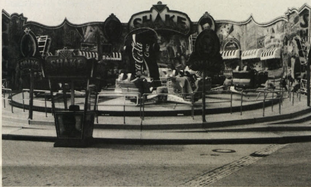
Hkrati s celovškim sejmom vabi na obisk tudi Gorenjski sejem v Kranju

Vojna naredi svoje. Še posebej taka, kot je v nekdanji Jugoslaviji. Prizadene vsakdanjik, človeka postavi v vrsto za preživetje, tisto biološko, prizadene medsebojne odnose, ruši vrednote. Nekdanji sodelavci in prijatelji si postanejo tujci, kultura, kolikor je še ostane, postane v „jugoslovanskem“ primeru nacionalna, znanost režimska ali pa izgine v ilegalo.