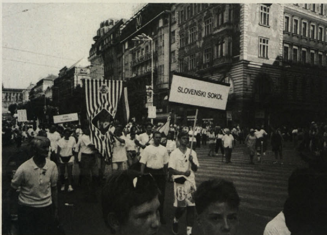
Slovenski mladi sokoli na mimohodu po praških ulicah