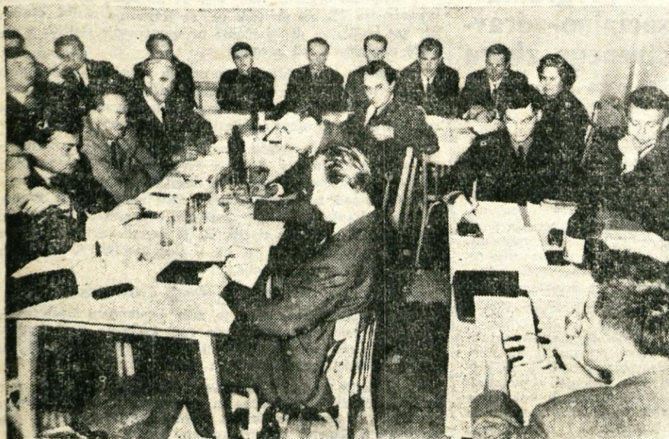
Občinski sindikalni svet v Kranju je od 19. do 21. septembra pripravil na Bledu seminarje za predsednike sindikalnih podružnic. Na seminarjih so razpravljali o letošnjih delovnih konferencah, sindikalnih podružnic in o pripravah na občni zbor občinskega sindikalnega sveta