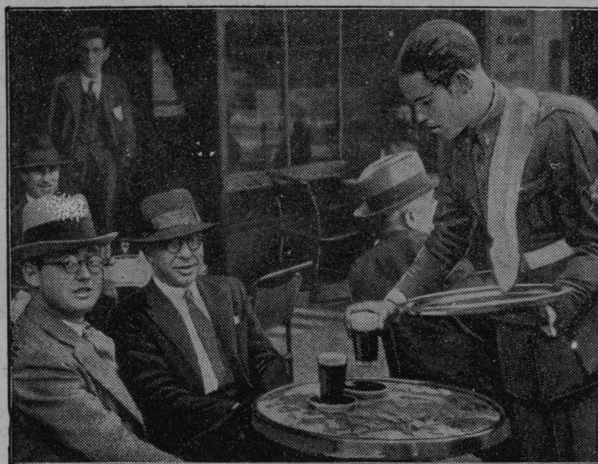
Dne 1. maja so stavkali v španskem mestu Barcelona natakari, katere je hitro nadomestilo vojaštvo.