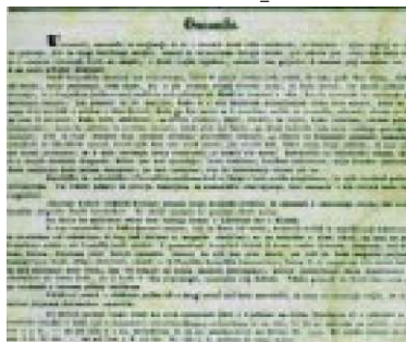
Kmetijske in rokodelske novice (1843-1902) -.