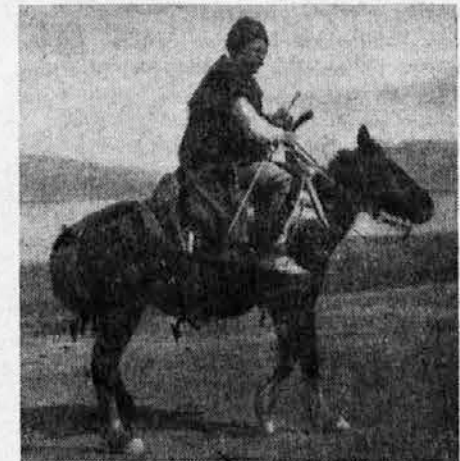
ALBANEC NA KONJU

Odgovorni urednik: Stanko Stančić Tiska tiskarna Budin v Gorici