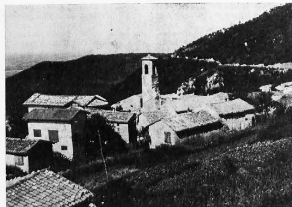
Čenebola v občini Fojda. Ljudje te vasice, ki leži visoko v hribu, so zadnje čase v zelo velikih skrbeh, ker krožijo govorice, da bodo ukiniteli avtobus, ki jih sedaj povezuje z dolino in ravninskim svetom

Letos je šla sagra sv. Andreja skoraj neopaženo mimo nas. Zvečer so bile gostilne kot po navadi skoraj prazne. Emigranti, katerih šteje tudi naša vas precej veliko število, se še niso vrnili domov in zato je povsod še vse puho in prazno. Okoli božiča bo pa že bolj veselo, ki bomo imeli v svoji sredi naše očete in sinove.