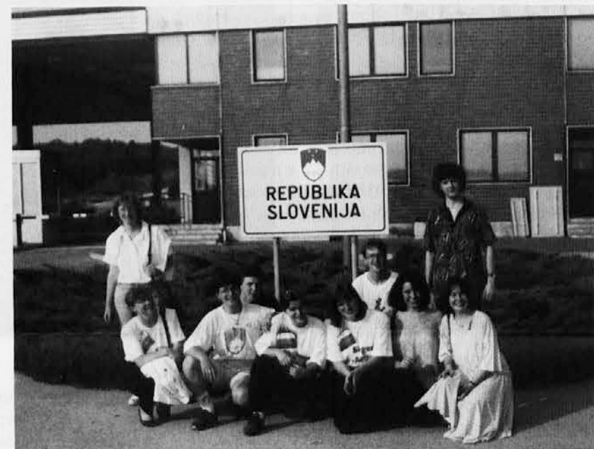
Mladi člani SKK (med njimi tudi organizatorji Mladinskega tabora) na mejnem prehodu pri Fernetičih v »vročih« dneh razglasitve slovenske samostojnosti