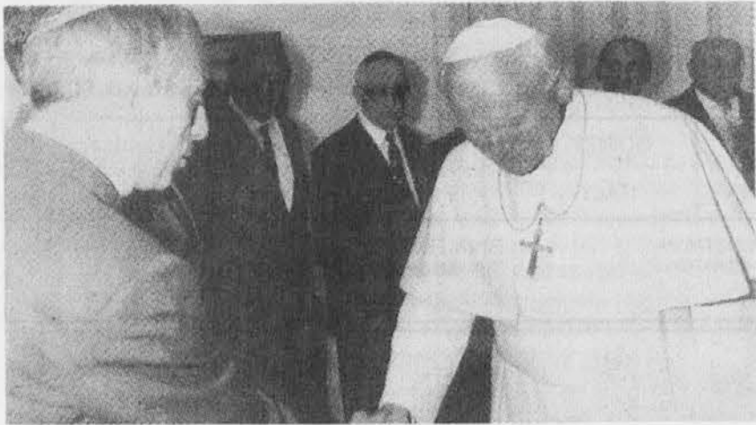
Sv. oče in židovski zastopniki v Budimpešti

Lansko leto ob tem času je bilo veliko srečanje mladih s sv. očetom pri sv. Jakobu v Komposteli na Španjskem. Takrat jim je napovedal: Prihodnje leto se srečamo v Čenstohovi na Poljskem. To se je uresničilo v tednu praznika Marijinega Vnebovzetja. Toda papež ni obiskal samo svetišče v Čenstohovi, temveč je uporabil obisk tudi zato, da se je ustavil v rojstnem kraju Hatovice in v svoji nekdanji škofiji Krakovu. Višek njegovega obiska na Poljskem pa je bilo srečanje z mladimi v Marijinem svetišču v Čenstohovi v sredo 14. in v četrtek 15. avgusta.