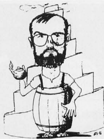
SLOVENSKI DIOGEN V BABILONU (MOTTO DRAGICE '91)