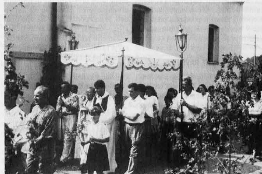
Procesija ob praznovanju sv. Lovrenca 11. avgusta na Vrhu sv. Mihaela

Oglaš: za vsak mm višine v širini enega stolpca: trgovski oglaš in osmrtnice 500 lir, k temu dodati 19% IVA