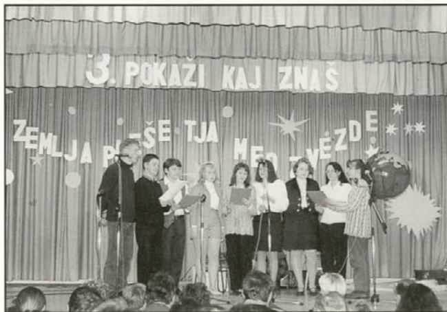
Mladi pevci iz Stoperc so se zbrani publiki v dvorani predstavili z večglasnim petjem. Zapeli so znano ljudsko pesem "Fantje po polj' gredo..."