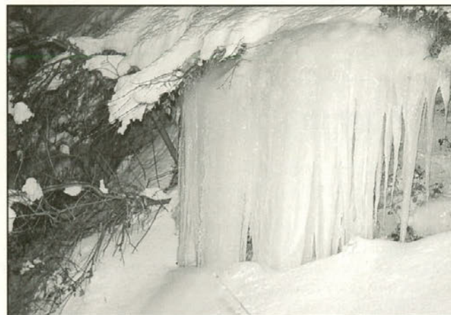
Čeprav je bila pot čez Bolfenk nevarna je bila poplačana ob pogledu na ledeni steber, ki ga danes ni več.