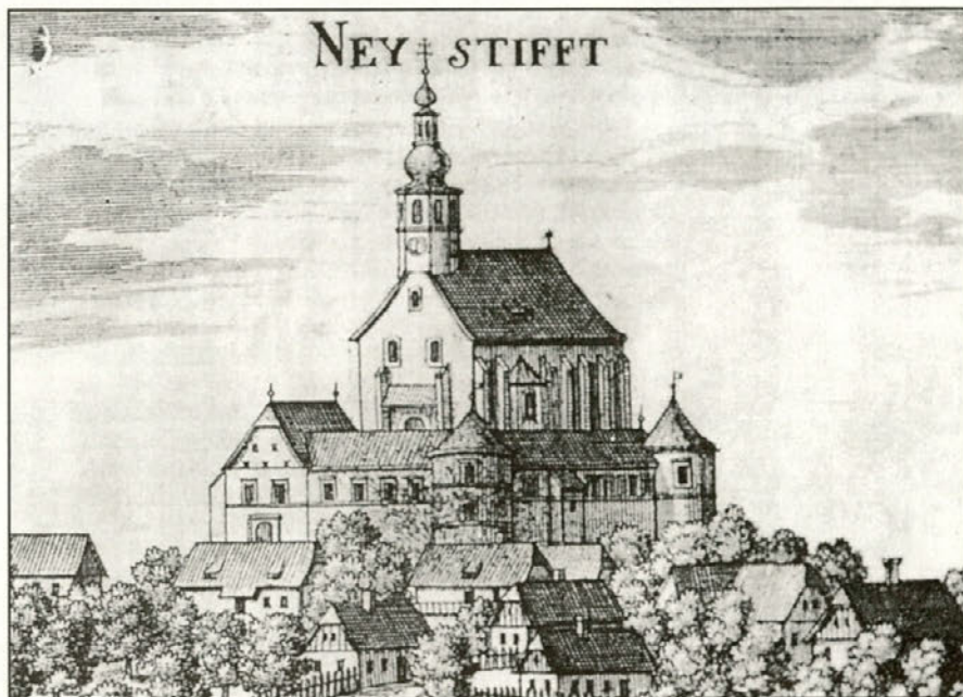
Ptujska Gora s taborskim obzidjem, kakor jo je leta 1681 upodobil G.M. Vischer v svojem delu "Topographia Ducatus Styriae"

Preden se bo bralec sprehodil skozi pričujoče vrstice, bo pri sebi po tihem pomislil: "Je to pisanje potrebno?" Upravičen pomislek, ker jo res poznamo in ker smo ponosni nanjo. Včasih pa se rado zgodi, da prav tisto, kar je naše, premalo poznamo ali pa temu ne damo potrebne teže. Prepričan sem, da glede gorskega svetišča ni tako, pa naj nam ga kljub temu te vrstice še bolj približajo.