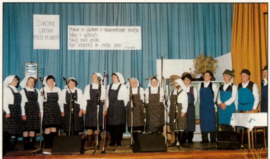
Nastop skupine ljudskih pevk in pevcev iz Stoperc na 23. srečanju ljudskih pevcev in godcev v Zavrču