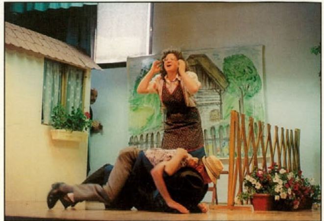
Prizor iz igre "Zdrahe na vasi".

Po mnenju Urada vlade za informiranje R Slovenije številka 4/3-12-1676/95-23/361 z dne 25. oktobra 1995, se šteje lokalno informativno glasilo DOBRE MARNJE za izdelek informativnega značaja iz 13. točke tarifne številke 3 za katerega se plačuje davek od prometa proizvodov po stopnji 5 odstotkov.