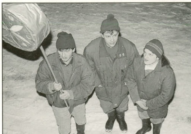
Čeprav so »trije kralji« prepevali vso noč, je njihova pesem zadonela tudi na srečanju.