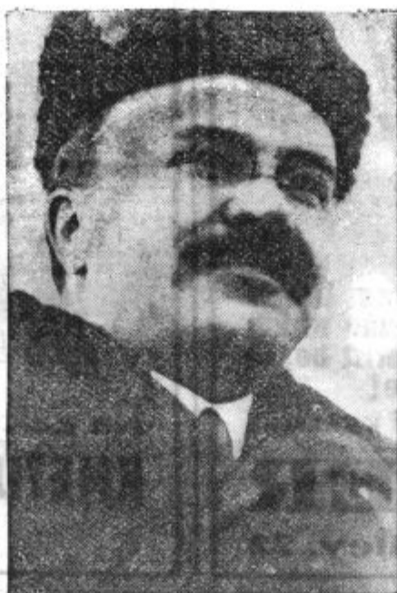
Molotov ruski komisar za zunanje zadeve

Kaj je rana? Rana je vsaka krvava poškodba, ki se zelo rada ognuji. Pri vsaki rani moramo najprej ustaviti krvavitev in preprečiti dohod bakterij v rano in kri. Bakterije so neskončno majhne stvarce, ki povzročajo gnojenje in radi tega kaj pogosto zastrupljenje krvi, česar posledica je največkrat smrt. Da preprečimo bakterijam dohod v rano in kri, moramo rano obvezati s popolnoma čisto in razkuženo obvezo. Seveda mora imeti tudi obvezovalec razkužene in popol-