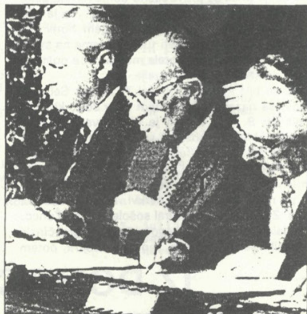
PEACE ACCORD — Serbian President Slobodan Milošević, left, Bosnian President Alija Izetbegović and Croatian President Franjo Tuđman sign the initial peace accord for the settlement of the war in Bosnia-Herzegovina.