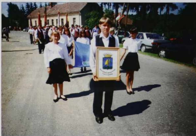
Povorka z grbom in praporjem

In zakaj sta prav črtalo in lemež v novem grbu? Pred načrtovanjem novih simbolov je samouprava dala raziskati v arhivu v Sombotelu, ali obstaja kakšna listina z dolnjeseeniškim žigom. Našli so listino z žigom iz 13. stoletja. V omenjenem žigu najdemo lemež in črtalo. Ta dva motiva sta prenešena tudi v novi grb, ki bi ga lahko opisali tako: v modrem polju