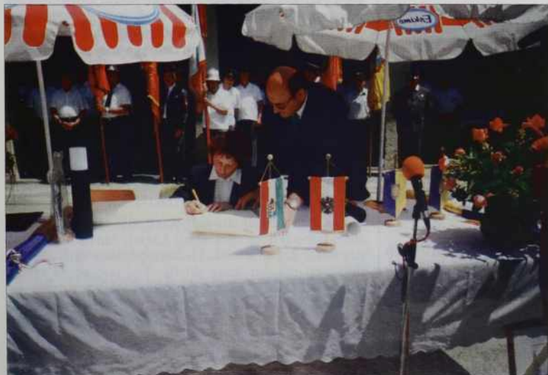
Podpis listine o partnerstvu

ščiata najdemo na zlato pobarvana lemež in črtalo, ki se nahaja nad tremi zelenimi bregovi. Nad ščitom je odprta grofovsko krona, zlato in srebrno pobarvana. Lemež in črtalo sta simbola kmetijstva, trije bregovi – kot novi motiv – pa simbolizirajo tri narodnosti, ki živijo na Dolnjem Seniku. Oblika ščiata ter krona spominjata na družino Batthány, kajti tudi Dolnji Senik je bil del njihove posesti.