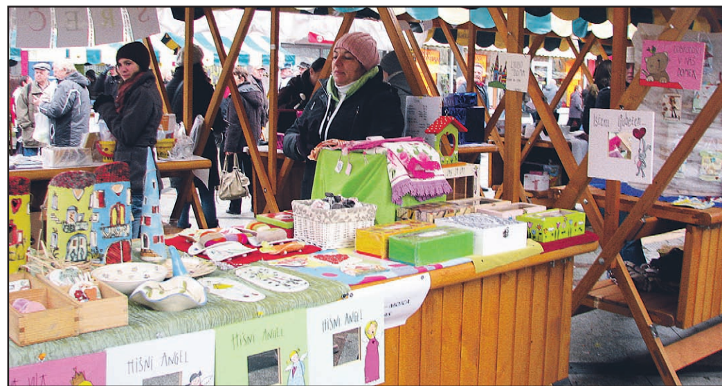
Praznične stojnice so bile polne zanimivih izdelkov in dobrot.

Trka, trka novo leto, staro leto se poslavlja, pozabimo vse slabosti, veselimo se novosti.