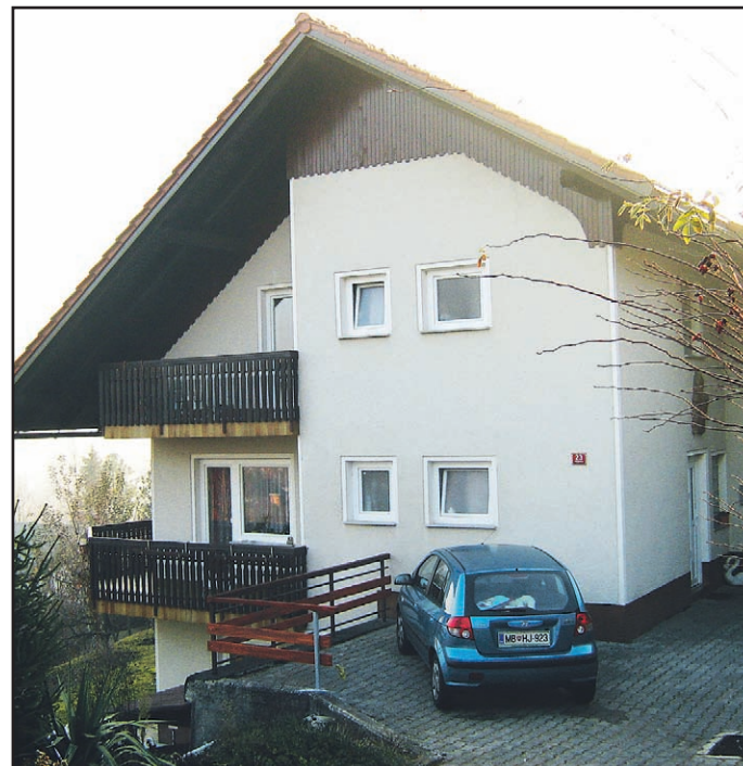
Andrejev dom v Mozirju: za ženske in otroke, deležne nasilja, sreča v nesreči.

Bivanje v domu jih stane 66,51 evra na mesec. »To je njihov skromni prispevek, ob dejstvu, da jim pomagamo z dobrinami, kot so hrana, obutev, obleka. To zagotavlja Karitas in nekateri drugi dobrotni-