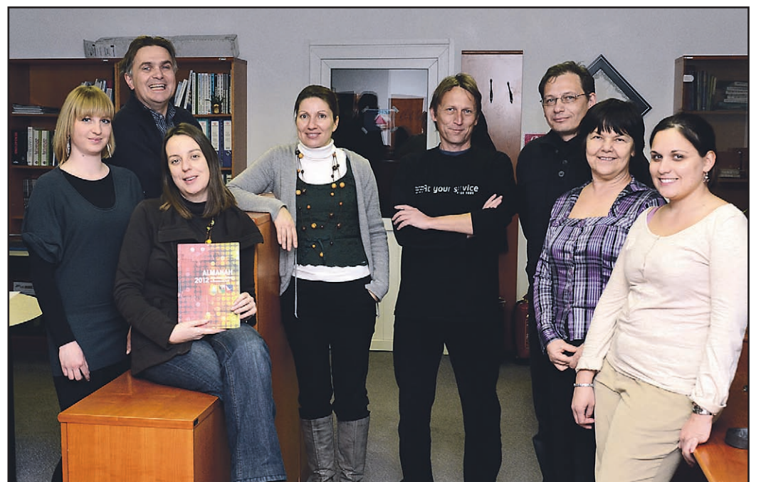
Pri pripravi pa sodelujejo še številni zunanji sodelavci