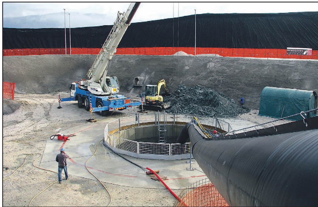
Pripravljala dela so se začela januarja. Končni svetli premer jaška bo 6,15 metra.

Tovrstni rudniški objekti se gradijo redko. Zadnji jašek v Šaleški dolini - zračilni jašek Šoštanj II - je bil zgrajen leta 1990