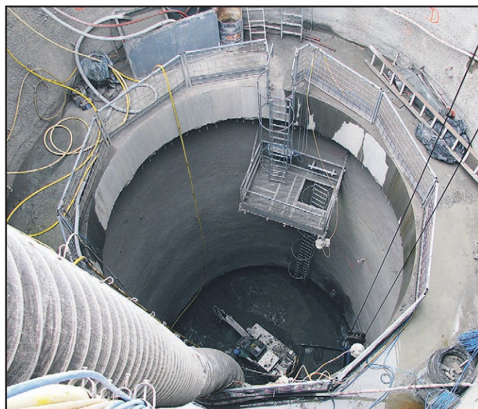
Po t. i. gradbeniški metodi so prišli do globine 27 metrov, globljenje po klasični rudarski metodi se bo začelo, ko bodo imeli dovolj globine za montažo visečih odrov.