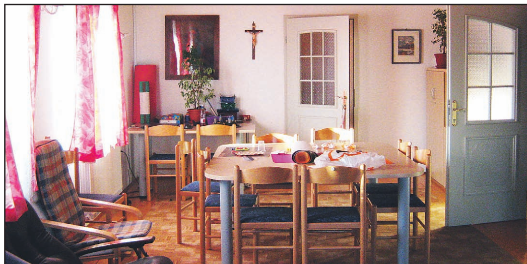
V dnevnem prostoru izvajajo različne delavnice.