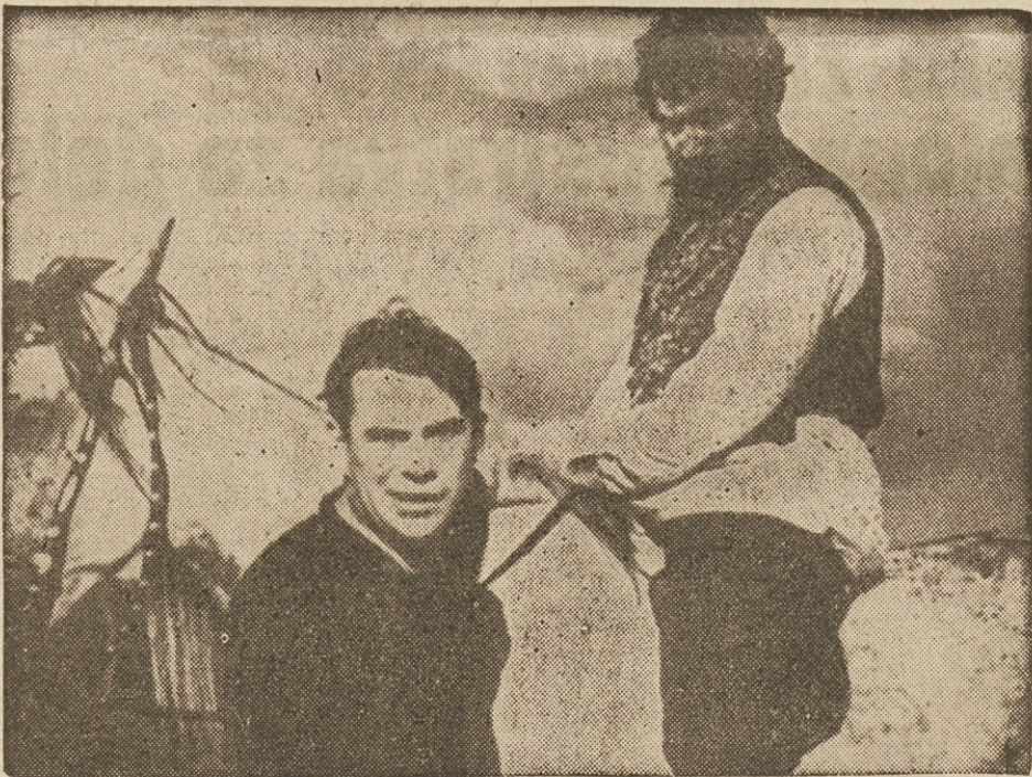
Prizor iz filma »Poslednji tabor«, ki naj si ga člani sindikata ogledajo

Nadzor delovnih pogojev. Izkoriščevalska oblast stare Jugoslavije je postavila razne ustanove, ki naj bi služile koristim delavcev. Ustanovila je Delavsko zbornico, ki je bila v rokah delavske gospode, ki je služila buržoaziji s tem, da je cepila enotnost delavskega razreda in ga odvržala od borbenega hotenja. (Delavci)