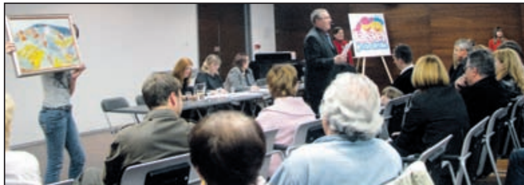
Polna dvorana tistih, ki so želeli pomagati.