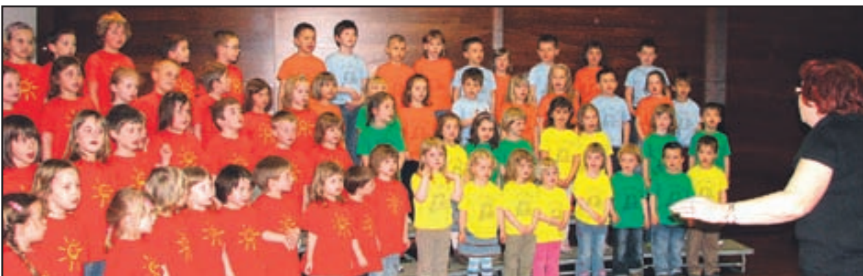
Naz aklučnjp rireditvi soo troci iz vrtcaN ajdihojca, kii majo dvap evszak borčka,z apeli nekajp esmic in bili pri tem, kotv edno,i zjemnos impatični.

odkrivali zaklade. Odkrivali smo jih celo leto, blizu in daleč. Otroke smo popejlali v svet lepega, prijetnega in dobrega. Z doživljanjem so spoznavali svet in si gradili vrednote. V jeseni smo izkoristili aktualne dogodke. Ob poplavih smo ugotavljali, da je voda zaklad, ker brez nje ne moremo živeti, po drugi strani pa lahko ogrozi tiste zaklade, ki so še bolj pomembni - dom, družino, imetje. Takrat so naši otroci spoznali pravljico o povodnem možu. Naslednje zaklade smo povezali s pravljico o zlati roži in o zlatih tolarjih. Spoznali so, da so stvari, ki so vrednejše od zlata in denarja. Spoznali so, da je več vredna dobrota in prijateljstvo, v sodelo-