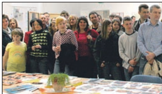
Utrinek z dobro obiskanega dneva odprtih vrat