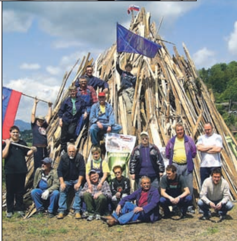
... Kres so prižgali tudi pod Belim dvorom na Gorici. Kresovanje je pripravila KS Gorica v sodelovanju z Mestno občino Velenje.