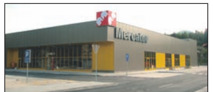
NovM ercatorjev arkets preminja tudip odoboo bčinskega središča.

Čeprav v zadnjem času ni slišati o nadaljevanju aktivnosti odbora za odcepitev naselja Roje na levem bregu reke Savinje iz občine Braslovče in za njegovo priključitev k občini Šmartno ob Paki, odbor ne miruje. Išče ustrezne poti za rešitev vprašanja, ki se tako ali drugače dotika blizu 100 krajanov.