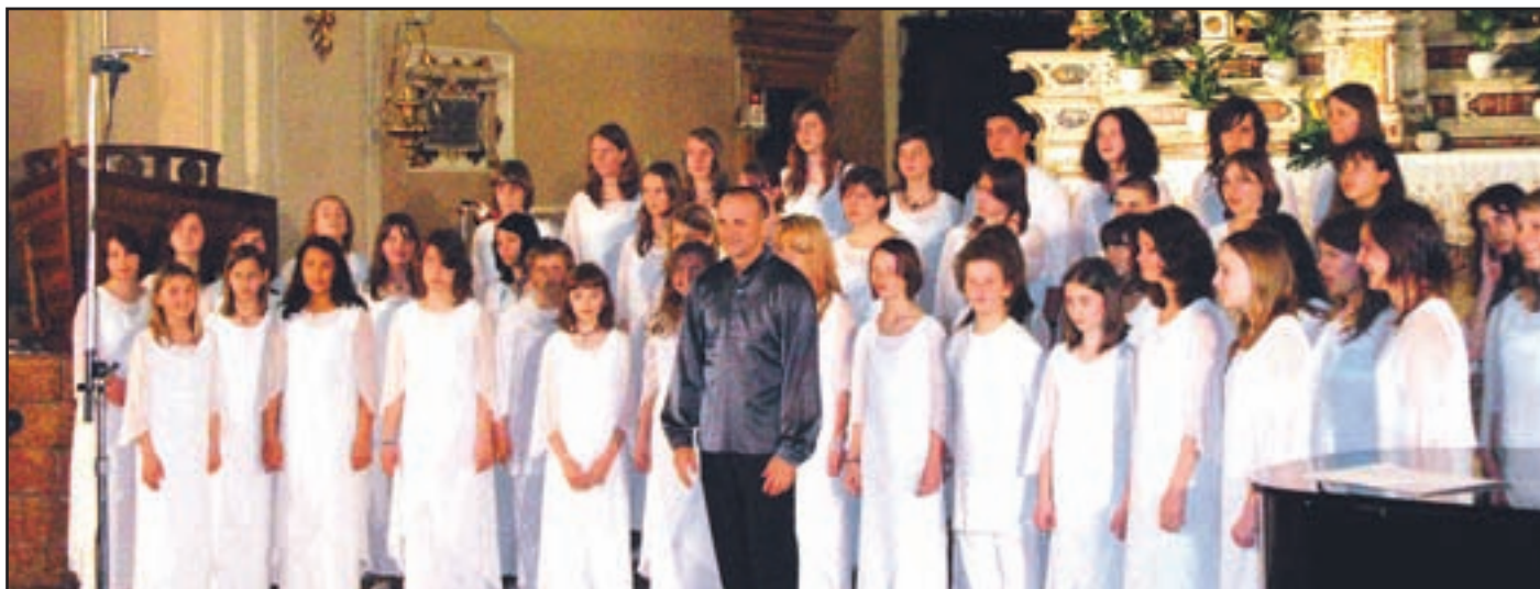
Zbor naz aključnemk oncertun agraencev

V tednu pred prazniki je mladinski zbor velenjske glasbene šole prejel na mednarodnem tekmovanju v Italiji pet nagrad - Proglašeni so bili tudi za najboljši zbor tekmovanja z najvišjim številom osvojenih točk in dosegli prvo mesto