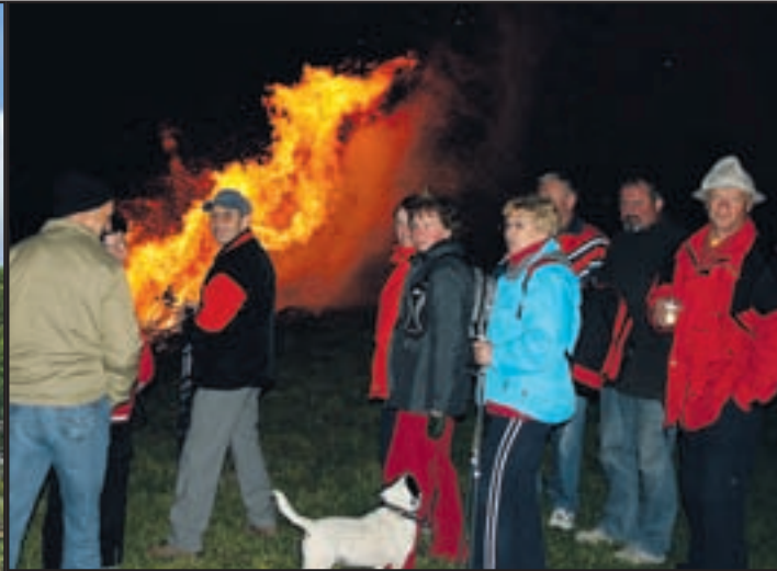
Na predpraznični večer je bilo prijetno in toplo tudi ob kresu na Ljubeli ...

samo eno preprečil dež, a je bilo zanj vse pripravljeno, dve pa sta bili pred tem na Paškem Kozjaku v organizaciji takratnega rudniškega sindikata.