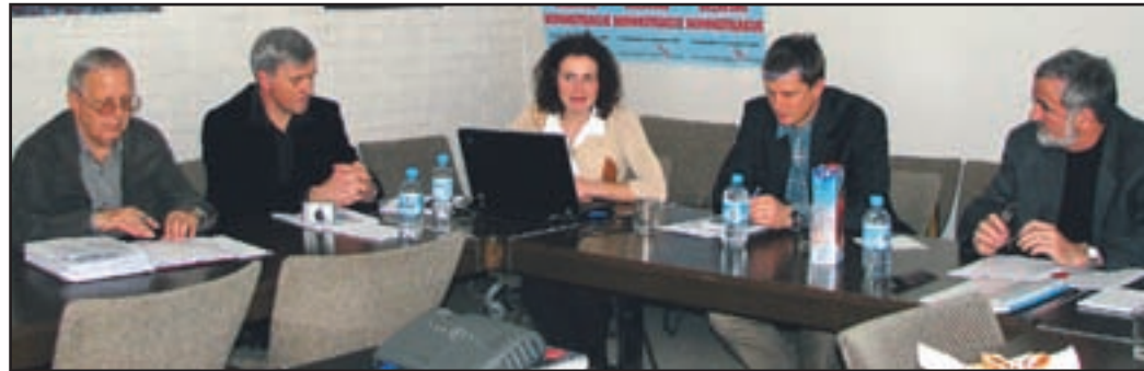
Članiz družjenjaC ivilnih nciativ obt retjir azvojni osi soe notni, dan jihovep ripombe in želje pos premembah nap redvidenit rasih itrec este niso bileu poštovane. Nado dgovorim inistrstva zao kolje inp rostor soo gorčeni.

za hitro cesto, saj je znano, da je bilo izdelanih več variant. Vztrajajo, da je za Šaleško dolino najboljša rešitev obnova obstoječih cest in ne novo umeščanje hitre ceste, ki bi, po njihovem, bila le odgovor zahtevam kapitala, domačini pa od nje ne bi imeli nič kaj veliko. Prepričani so namreč, da je zaradi cestnin sploh ne bi uporabljali in da bi promet na sedanji cesti Velenje-Arja vas še naprej ostal zelo gost. Predvsem zato, ker se tisti, ki bodo potovali v Celje ali proti Mariboru, verjetno ne bodo vozili na Šentru-