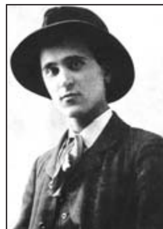
Umetnik leta 1908 na Dunaju

Razstava, ki bo v enem osrednjih in najbolj elitnih dunajskih razsta-