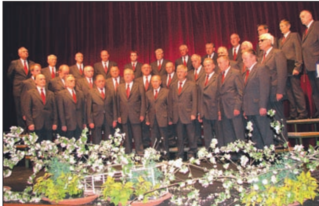
Partizanski pevski zbor poje pesmi, ki so nastale v najtežjih trenutkih.