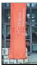
Novinarji so opozarjali na pomen svobode tiska.

Hrvaški predsednik Stipe Mešič je v redni mesečni oddaji hrvaškega radia dejal, da bo »tukaj Slovenija, če bo mednarodno sodišče tako odločilo. Poudaril je, da bo Hrvaška, ki jo on predstavlja, sprejela vsako odločitev Meddržavnega sodišča v Haagu. Med drugim je dejal, da nihče nima pravice do hrvaškega ozemlja. Spomnil je, da je to sporočil tudi Srbom v začetku 90. let minulega stoletja. »Bilo je preveč takšnih gesel 'Tukaj je Srbija' po Kninu, Obrovcu in na hrvaškem bregu Donave. Tega nisem mogel sprejeti, ker to ni bila Srbija,« je povedal Mešič.