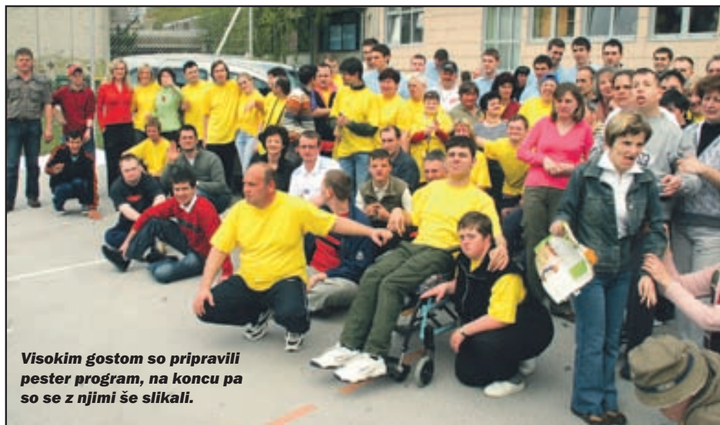
Visokim gostom so pripravili pester program, na koncu pa so se z njimi še slikali.