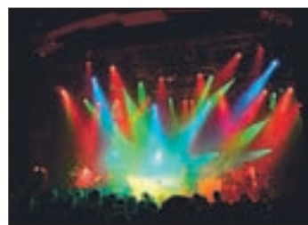
Komu Szas nakaže honorar, ko izstavi račun za anonimnega izvajalca?