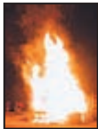
Goreli so kresovi.