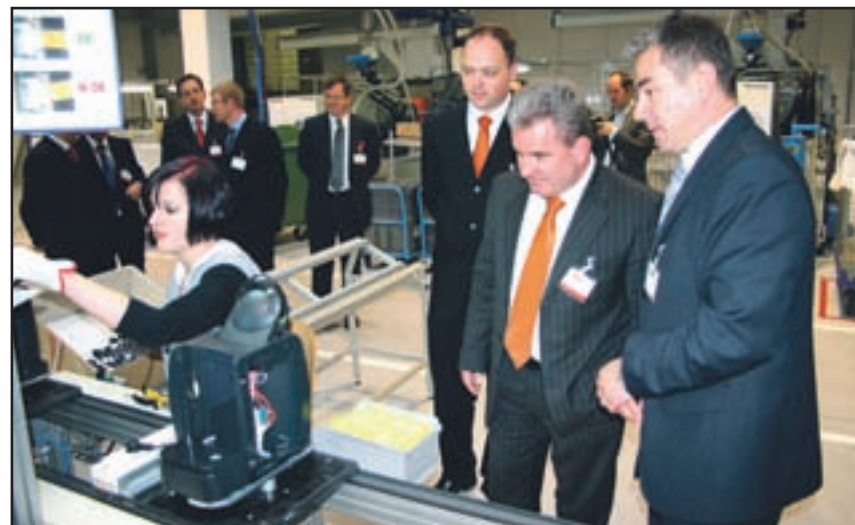
Minister Vizjak medo gledomp roizvodnje novihg ospodinjiskihaparotv.

V BSH Nazarje so vrednostno proizvodnjo v zadnjih 10 letih petkrat povečali - Dober zgled za tuje vlagatelje