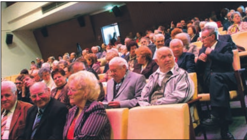
Svečanost je bila preprosto lepa, o bčinstvu avdušeno.