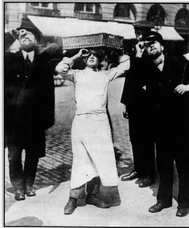
Sončni mrk 17. aprila 1912

V polovici minute se je naredila večerna tema. Med ljudmi je završelo: ploskanje, vpitje, žvižgi, klici, omedlevanja... Neverjetno doživetje! Vso pokrajino je pokrivala modrikasta nepopisna svetloba. Bil je večer, in vendar ni bil večer; bil je 11. avgust, in vendar ni bil več 11. avgust. Z ladjic in z nasprotnih obale jezera so samo gledali bliskavice fotoaparátov. Nemo je na obzorju sijalo v rdeči svetlobi. Črno sonce nad nami pa je strašilo s svojim mrkim (!) obrazom in grozečo krono žarkov. Mrazilo nas je: druge zaradi pomanjkanja svetlobe, mene zaradi konca sveta... Niso me toliko skrbeli dolgovi, ampak ves denar, ki mi ga kdo - tu pa tam - še ni izplačal... Nekajkrat sem s prostim očesom pogledal sončno krono. Misli