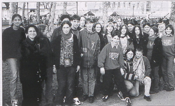
Dijaki in dijakinje 5.a razreda Slovenske gimnazije na Slovenskih dnevih knjige v Ljubljani.