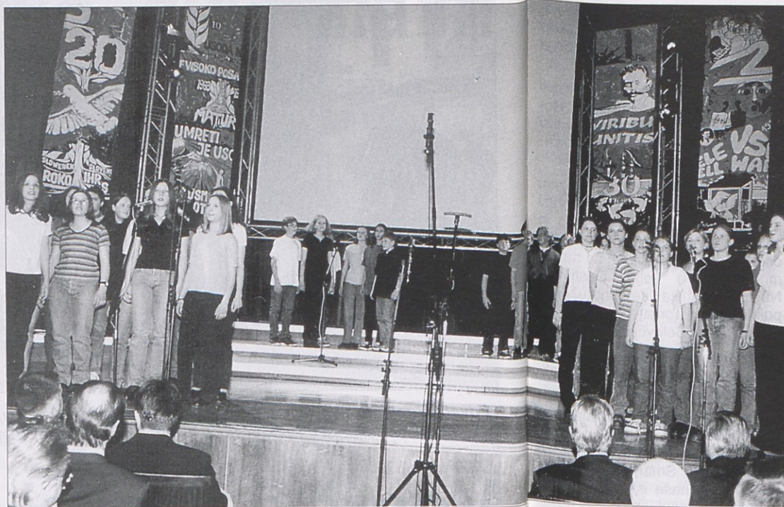
Dijakinje in dijaki so za 40-letnico svoje gimnazije pripravili veličasten kulturni spored.