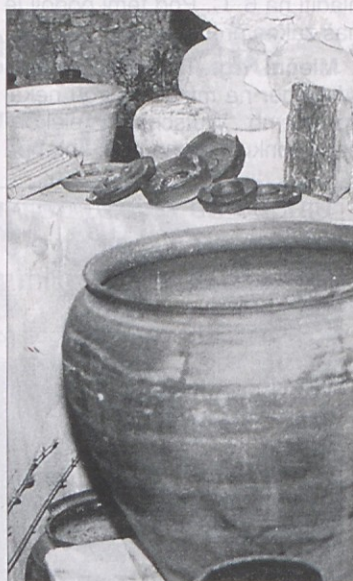
Na razstavi si je možno ogledati izredno lepe eksponate.

raško skupino, leta 1906 je nastal v Borovljah „Tamburaški odsek telovadnega društva SOKOL“ instrumente in partiture so dobili iz Zagreba.