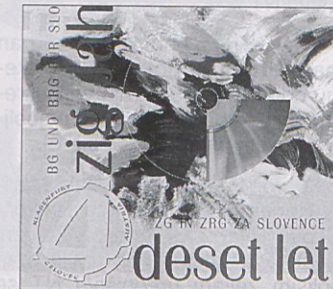
V zborniku so med drugim navedeni vsi dijaki, ki so obiskovali šolo.

Zbornik je založila Mohorjeva v Celovcu; dosegljiv je v Mohorjevi knjigarni in na tajništvu Slovenske gimnazije. Cena: 450,- ATS (brez vložene zgoščenke 320,- ATS).