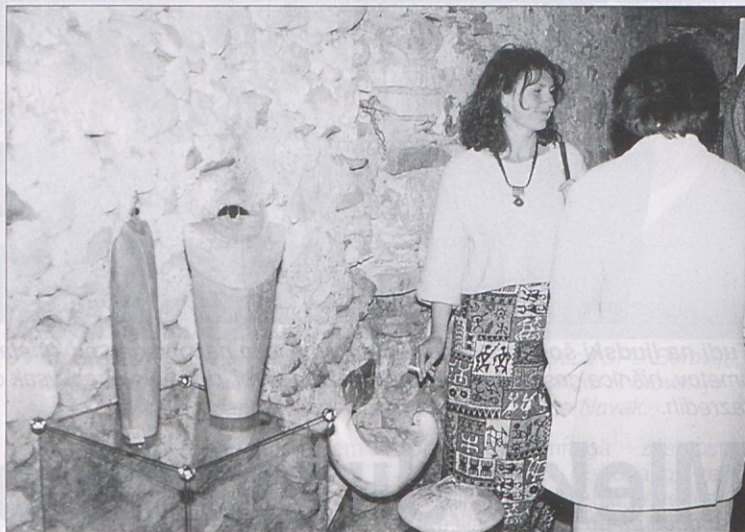
Razstava bo doselej odprta ob koncu tedna, torej od petka do nedelje. Možno pa se je tudi med tednom posebno najaviti.