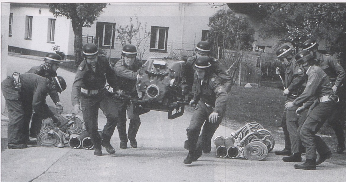
V dveh skupinah tekmujejo Vogrjani na gasilskih prvenstvih. Prva, mlajša skupina se pripravlja na koroško prvenstvo, starejši gasilci pa so se osredotočili predvsem na mednarodna tekmovanja.