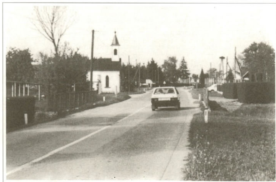
Magistralna cesta skozi Šikole