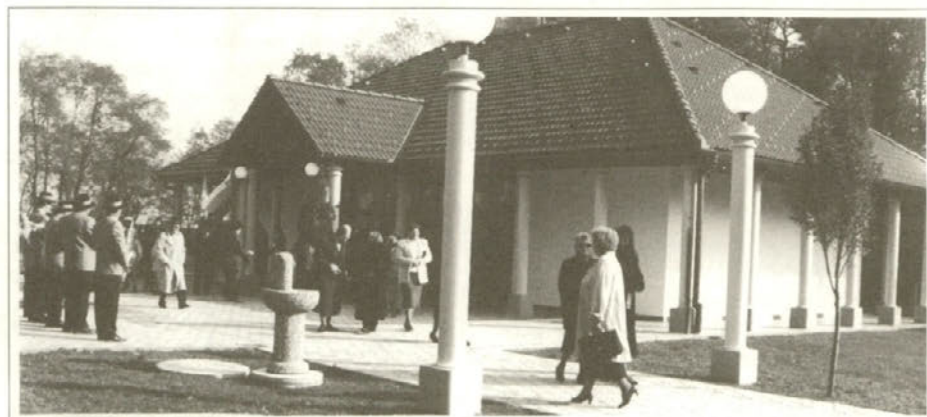
Nova in moderno urejena mrliška vežica na dan odprtja