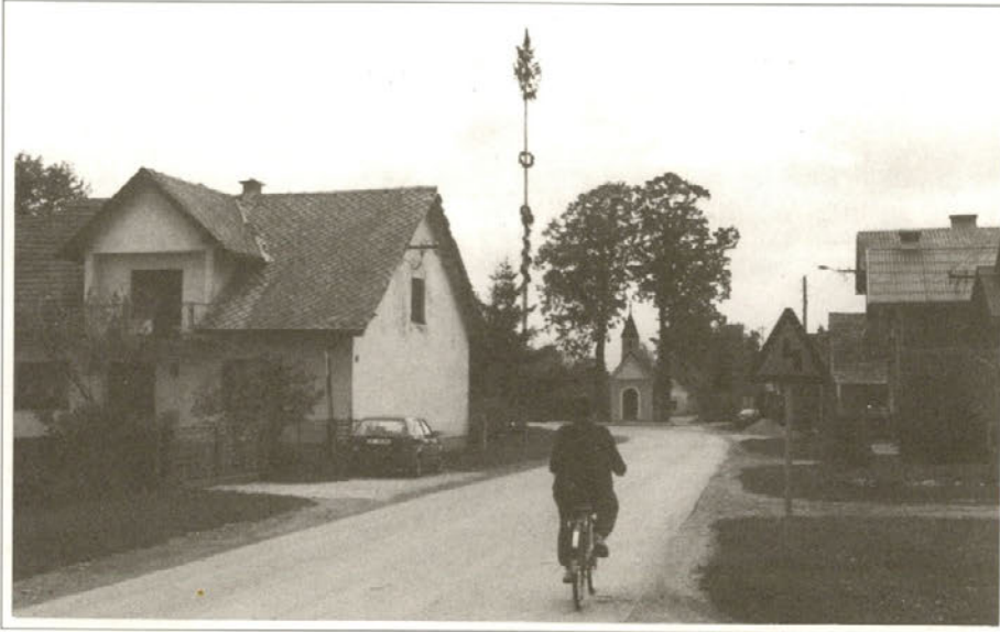
Sprehod skozi Pongrece

Pongrece prijavljenih 133 vaščanov, ki živijo v štiridesetih stanovanjskih hišah. Pongrece so tipična panonska vas. Toda tudi v Pongrech smo ob novogradnjah in obnovitvah nekdanjih bivalnih prostorov porušili nekdanjo izvirno značilnost Dravskega polja. Le nekaj starejših objektov, žal že močno načetih, še kaže staro podobo. Značilnost vasi je, da so v zahodnem delu vasi gospodinjstva, katerih člani združujejo delo v različnih delovnih organizacijah oziroma so obrtniki, v