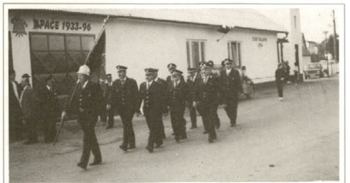
Otvoritev gasilskega doma — 1996