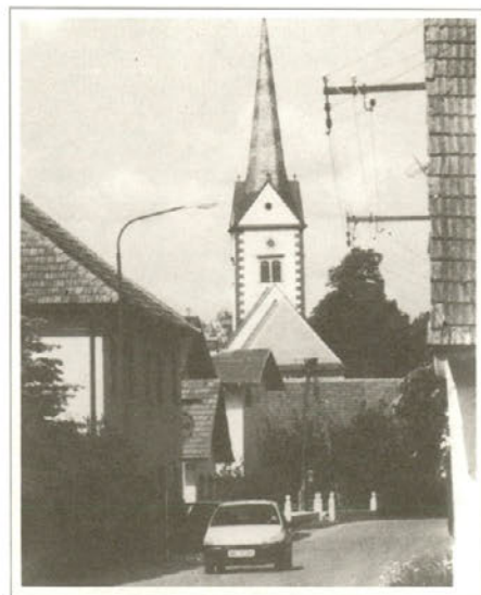
Preplastili smo vse krajevne ceste

Spoštovani krajanji in krajanke Lovrenca z okolico. Kot nam je znano, smo v letošnjem letu člani KO Lovrenc imeli veliko dela, saj smo izvedli veliko akcijo. Preplastili smo vse krajevne ceste in asfaltirali tudi nekaj odcepov. Treba je poudariti, da so vse omenjene ceste bile 95 % dotrajane in uničene. Veseli nas, da je zmagal razum in ste prislunili finančni akciji, saj je tako vsak prispevek pomagal k razvoju in modernizaciji samega kraja.