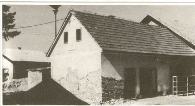
Stari gasilski dom — porušen v letu 1989

Najprej so se lotili krpanja lukenj na vseh krajevnih cestah po Apačah, gramozirali so poljske ceste, namestili delno cestno signalizacijo, obnovili talne označbe, kraj pa je lepši tudi zaradi obnovljene fasade na gasilskem domu in prosvetni dvorani. Še pred praznikom Apač so posadili 25 dreves javorja.