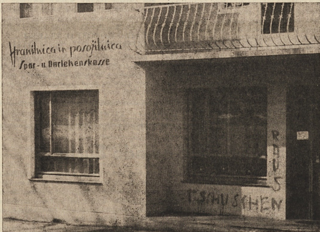
V noči od 11. na 12. marec so neznani storilci premazali poslopje Hranilnice in posojilnice v Dobrli vesi s sramotilnim napisom »Tschuschen raus«.

mals ihr Österreichbewußtsein? Aber daran wären die dekorierten Kämpfer, die am Sonntagnachmittag demonstrativ die Burg umstanden, als die Theatergäste eintrafen, wahrscheinlich nicht gerne erinnert worden. Wenn der Bürgermeister von Arnoldstein vor einigen Wochen geäußert hat »Das Vermächtnis der Abwehrkämpfer bedeutet Friede und Freiheit«, so haben wir darin einen sehr ernstzunehmenden Beweis der Annäherung erblickt, über den wir uns ehrlich gefreut haben; der Völkermarkter Abwehrkämpferbund denkt anders, etwas gestriger, wenn man so sagen darf. Die Slowenen erkennt man so lange an, als sie Ruhe geben, sich nicht bemerkbar machen. Man mißt mit eigenen Schuhen und sagt: kulturelle Aktivität ist politische Aktivität. Ja, und dann siegte wohl die Einsicht, daß die Slowenen ohnedies vor einem leeren Saal spielen müßten, denn in Völkermarkt gebe es ja nur 16 bis 20 Slowenen. Die Weißglut war sicher hoch, als die Völkermarkter Theateraufführung einen ausverkauften Saal sah.