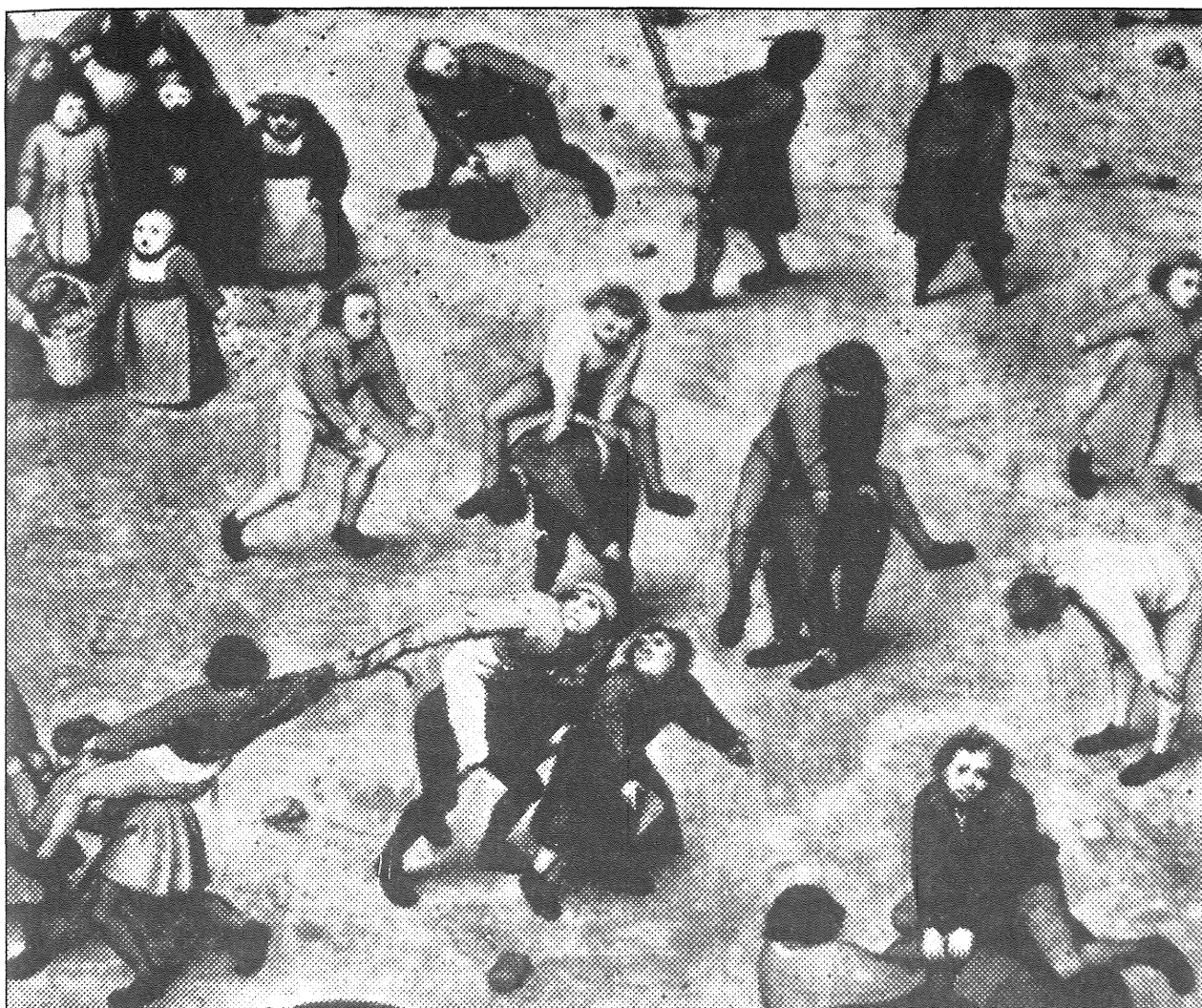
Skakanje "čez kozo", P. Bruegel, Otroške igre (1560), detajl, Kunsthistorisches Museum Dunaj

- "Dominik, rad bi, da se sporazumeš z Almerikom!" ( Dominice, ego volo quod tu te acordes cum Almerico! )