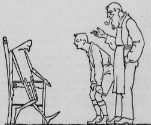
»Kako sem bil smešen, ko sem bil dondek! In kako sem zdaj srečen, ko sem postal deček, kot se spodobil!...«

»Zato, ker prinesejo otroci, ki se temeljito poboljšajo, tudi v njihove družine novo in veselo življenje!«