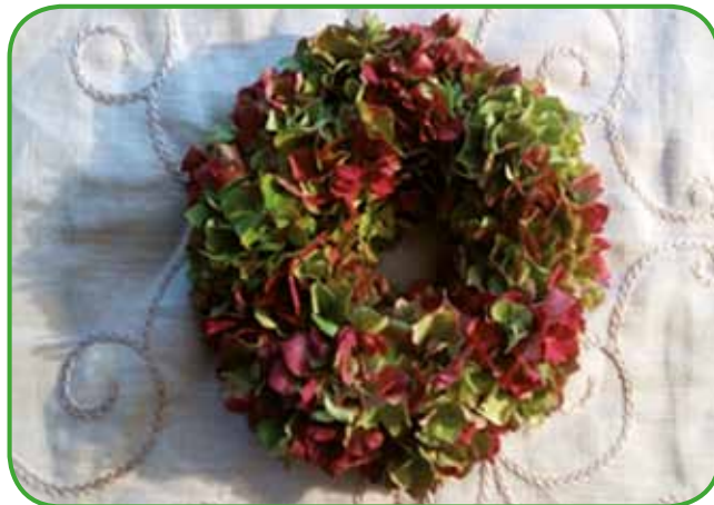
Nekaj najlepšega je, če te pred vhodom pozdravi lep venček iz svežega sezonskega cvetja.

jo do izraza cvetna stebela. V tem primeru damo v vazo le malo cvetov. Prav je, da šopek spoštljivo prevzamemo in ga postavimo v vazo z mlačno vodo. Cvetju bomo podaljšali življenje, če bomo zamenjali vodo na vsaka dva do štiri dni. Ne pozabimo dodati hranila za cvetje.