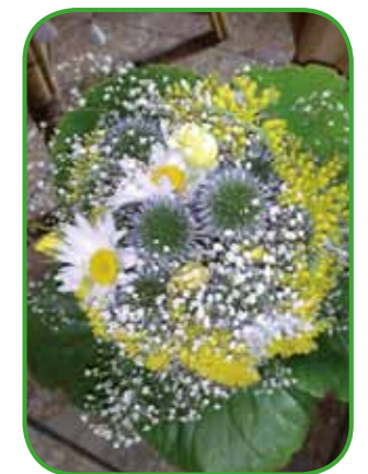
Bergenia je sicer spomladi cvetoča trajnica, vendar listi so uporabni skozi celo leto.

tone med glavnima barvama. Zelenje pri izdelavi šopka dodajamo nazadnje.