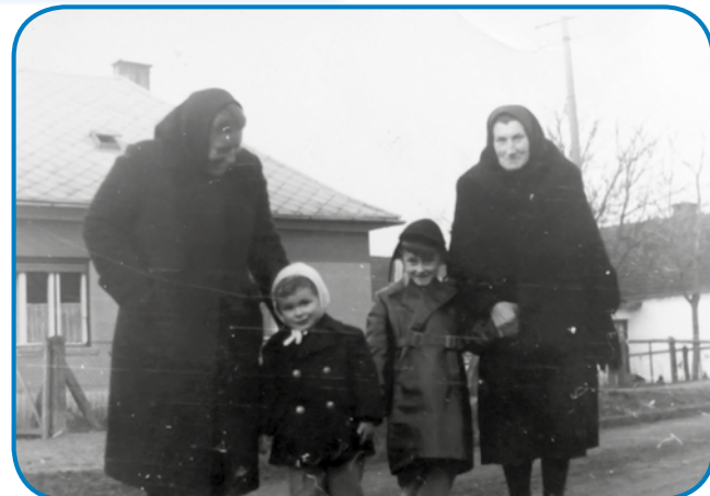
Z babico pa tetico

»Dja sem štiri lejta stara bila, brat pa dve, gda nama je mati mrla, v kratkom časi pa oča odišo v Meriko. Nej sem mejla nej očo pa mater, depa itak