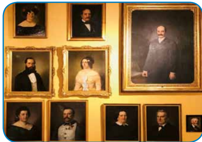
Del z razstave

ših oken. Leva, ožja vrata imajo ob straneh polkni, ki nakazuje, da je šlo za vhod v lokal. Vse do druge polovice 19. stol.