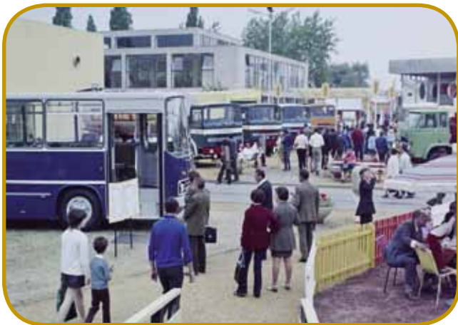
Lüstvo gleda vreve madžarske industrije: autobus Ikarus ino tovornjake z gyórske fabrike Rába (senje »BNV« v leti 1973)

Tisti, šteri so leko kaj prišpárali, so s svoji penez kúpili stanovanje ali zidali ram. V petnajset lejtaj so zozidali više miljaun stanovanj, od toga največ v »ižini fabrikaj« (házgyár). Dobiti edno takšo stanovanje je bilau sploj veuko veseldje za mlade pare, šteri so prva brezi komforta živeli. V nauvi kva-