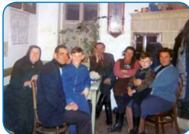
Velka držina v staroj kūnji