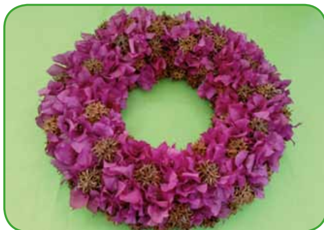
Trdolesko je bilo treba pomladiti in iz zelenja sem spletla venček.

cinije, zajčke. Naravo spoštujem in jo obiskujem ter si iz nje marsikaj prilastim, vendar je ne oskrnim. Narava je od nekdaj najtesneje povezana s prekmurskim človekom.