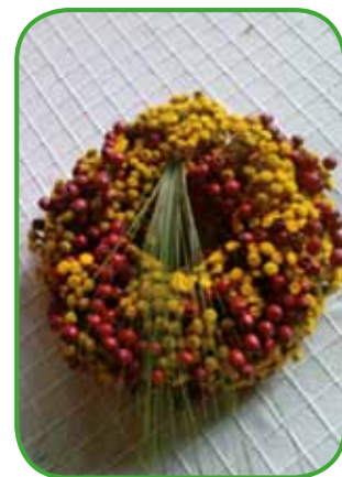
Vratič, šipek in trava so v venčku, ki je primeren ob različnih priložnostih in za različne namene.

Urejanje cvetja je postalo priljubljeno opravilo, pri katerem razvijamo svojo domišljijo, se sproščamo, uživamo in si prostor, kjer prebivamo, naredimo prijeten. Cvetje je za