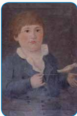
PORTRET ... stran 45