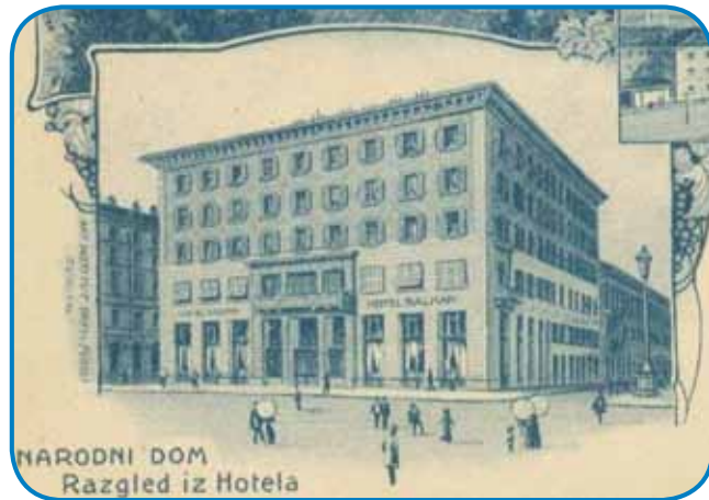
Tržaški Narodni dom na razglednici iz začetka 20. stoletja - sledi mirnejših sto let?

še konferenčne in razstavne dvorane v pritličju. Od februarja 2014 v Narodnem domu deluje Oddelek za mlade bralce knjižnice.