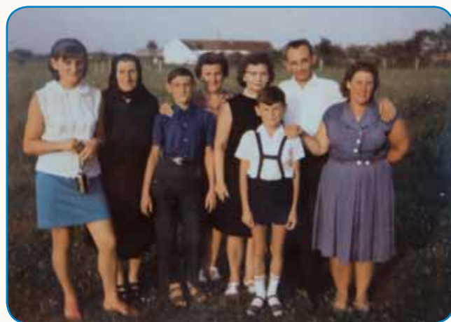
Več starišov sem mejla stran 8