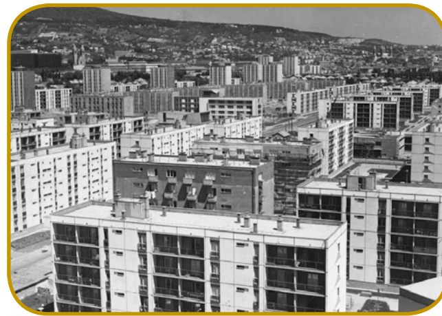
Blokovsko naselje »Uránváros« v Pécsi (1968) - v etom tali varaša eške gnes 25 gezero lüdi živé

Vlada je stejla pomagati, zatok je začnila zdigavati plače. Za tau je mogla gorvzeti