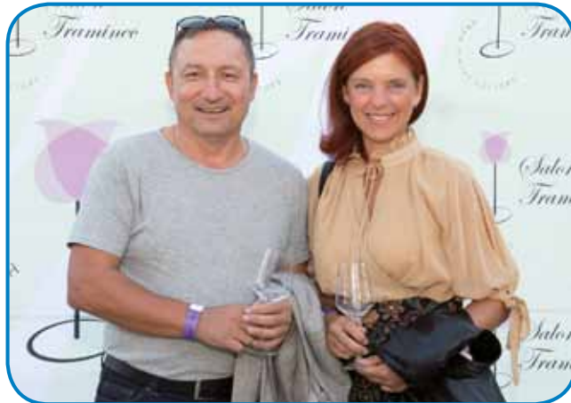
Z Matejo na prireditvi Salon Traminac

ga je iz domanje vesnice paut odpelala v Mursko Sobotu, gé je začno oditi v gimnazijo. Med kednom je živo v dijaškomy daumy, gé se je vsefele zanimivoga godilo. Komaj te, gda je prišo v štrty razred, so zazidali nauvi daum, prva pa so poj-dje živeli v staroy zidiny, pauleg