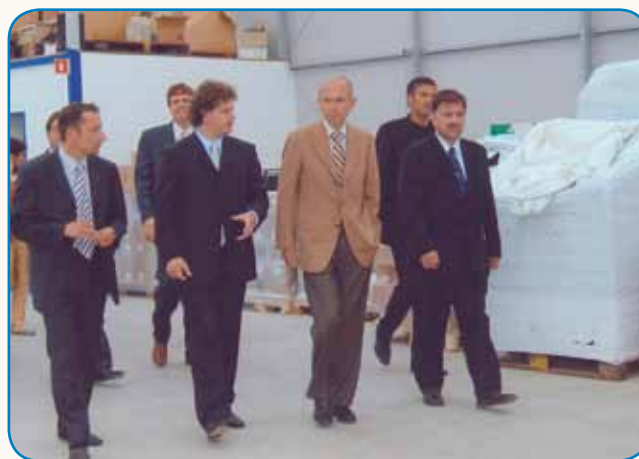
Vsiger je biu Polančar, pa de tau tudi osto stran 9