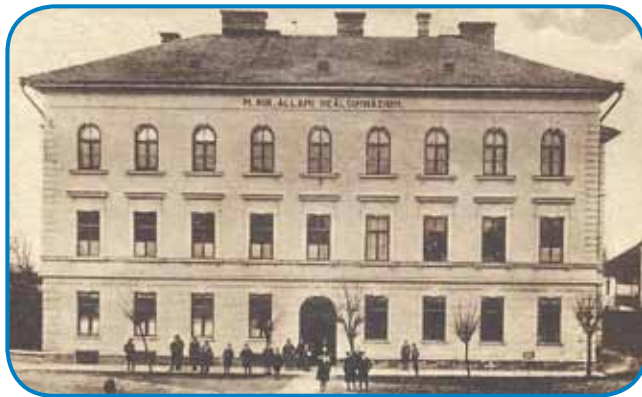
Stara fotografija Gimnazije Monošter

Prvi del raziskovanja se je s tem končal. Po načrtih bo raziskovalka v preostalem delu poletja sistematizirala podatke, ki jih je zbrala na dveh obiskih, in jeseni želi objaviti publikacijo o zgodovini Gimnazije Mihály Vörösmartyja