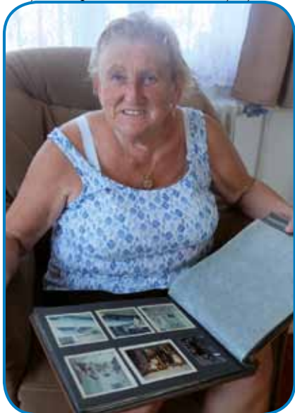
Panni Bartakovič ma vse stare kejpe v albumaj

spjoj lejpi žitek sem mejla, gda sem mlašě bila. Dja sem vsepovedik odla v rodbini, enga do drūgoga, mena so tej vsi oča pa mati bili. Še zdaj njim ne