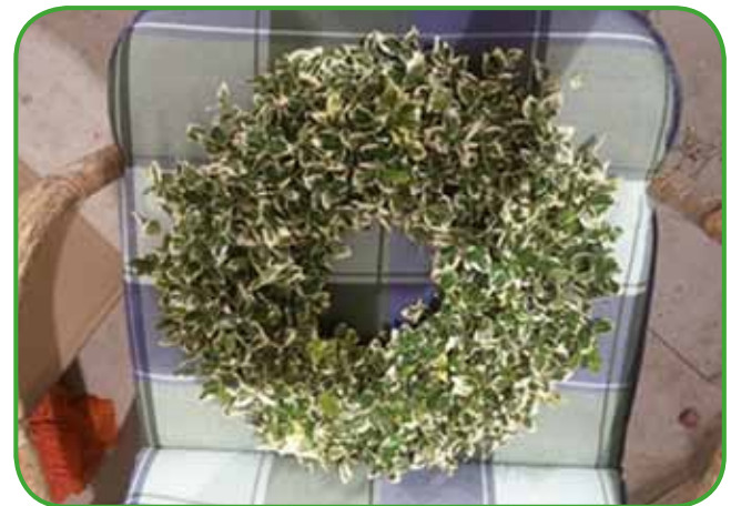
Venček iz odpadlih cvetov bougenvileje in plodov ambrova. Domišljija ne pozna meja. Ne samo za advent ali veliko noč, venček na vratih lahko razveseljuje vse leto.

ali daljših, ko se ne moremo upreti najrazličnejšemu sezonskemu cvetju. Izbira je velika. Dobro je, da damo cvetje čim prej v vodo, da do