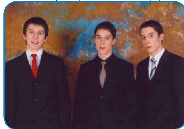
Na svojy try sine je trno ponosen

aj naj pridem za direktora Nafta.« Tistoga cajta je trbelo tau velko firmo, stera je v najbaukšy lejtaj davaly delo 1400 delavcon, pa na noge postavity: »Tak kak za dosta firm, tak v Prekmurjy kak indry, je dosta krivo bilou tau, ka se je politika malo preveč spravlyala z namy in je dostakrat fontoško bilou samo tau, ka je človek naš in nema veze, če ma samo dva razreda osnovny šaule. Po tistomy sam, mislym ka 2010.