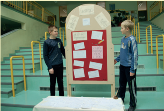
Utrinek z razstave

Tudi v tem šolskem letu je naša šola sodelovala v Tednu pisanja z roko, ki ga ob podpori Ministrstva za izobraževanje, znanost in šport in Zavoda RS za šolstvo pripravlja društvo Radi pišemo z roko. Osrednja tema letošnjega tedna, ki smo se mu priključili med 20. in 24. januarjem 2020, je bila »V naši družini radi pišemo z roko.«