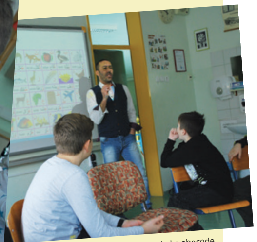
Spoznavanje arabske abecede