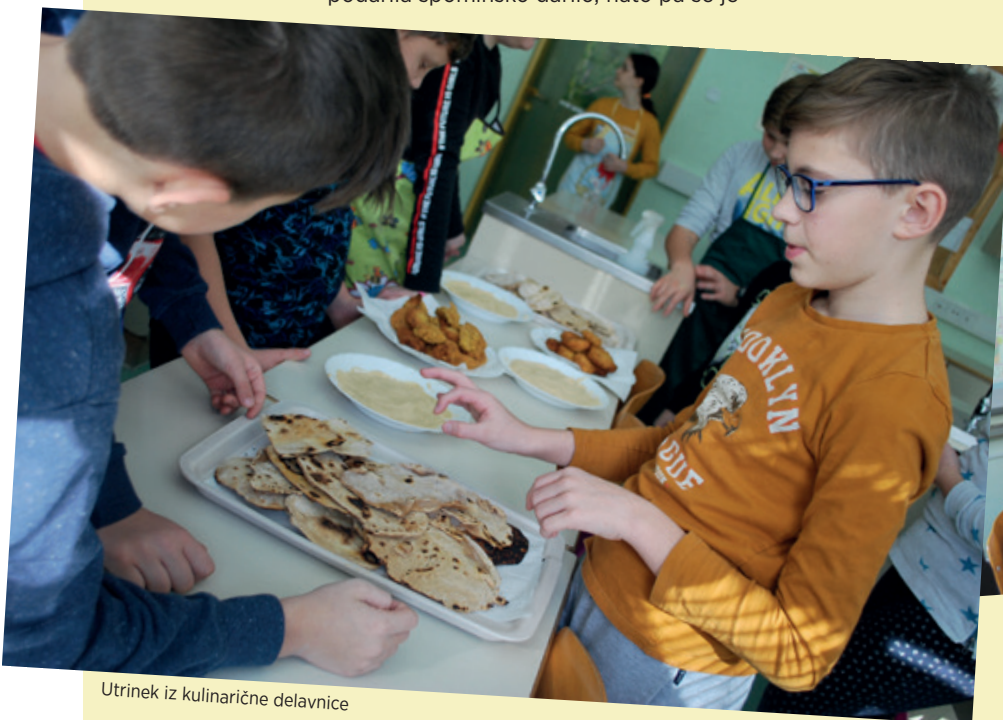
Utrinek iz kulinarčne delavnice