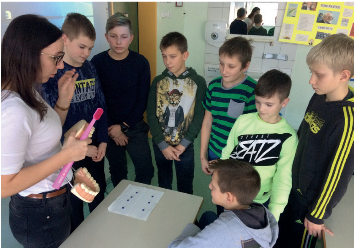
Zobna preventivna sestra na obisku v šestem razredu