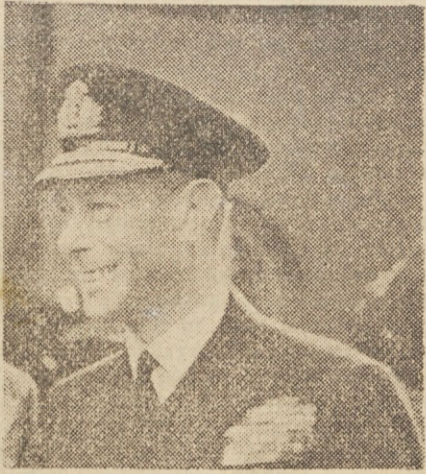
Božični nagovor kralja Junija VI.

Kralj Jurij VI. je imel 25. t. m. na svojem gradu Sandringham običajni božični nagovor na narode britanskega imperija, v katerem je med drugim dejal: