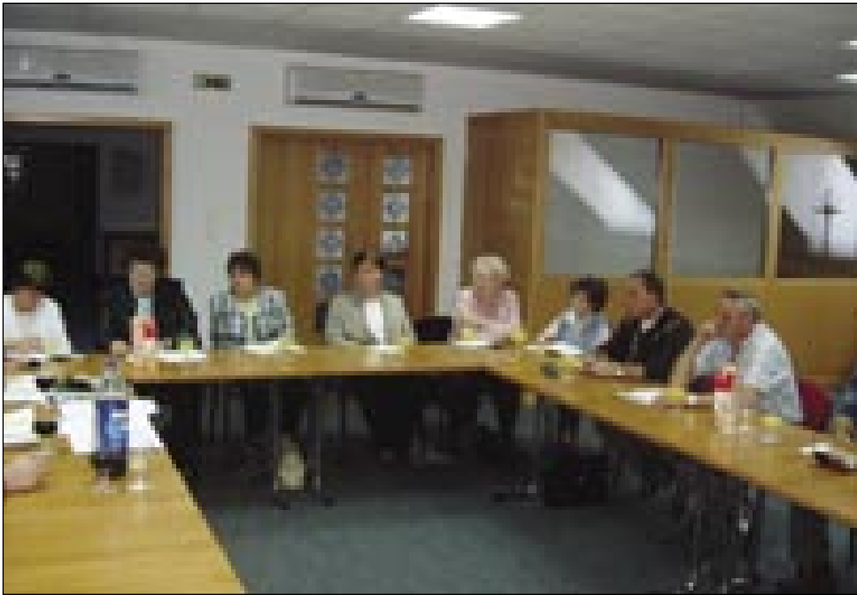
Na zadnjom djiejši predsedstva v tom mandati. 18. novembra de mejla Zveza volilni občni zbor

skom geziki tü, tau pitanje je nastalo v nas. Zatoga volo pozovemo vküper vse 6 mlade, steri redno študirajo pa tiste tri tö, steri so na cejljetnoj šauli slovenskoga jezika, naj zvejmo, sto za koj se vči vö, ka bi radi meli za delo. Tiste funkcionare tü vcuj pozovemo, steri njim kašno delo leko