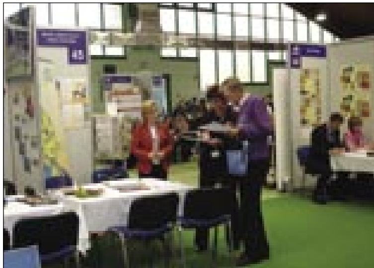
Utrinek s slovenske turistične borze v Randencih

dek – Slovensko turistično borzo 2006, za turistični slogan pa VODO. V Radence oziroma Pomurje je prišlo 190 organizatorjev potovanj, agentov in prevoznikov, ki so zastopali 147 podjetij v triindvajsetih državah. Organizatorji so novinarjem posredovali tako informacije o velikih načrtih, ki jih ima Slovenija v turizmu med letoma 2007 in 2013, kakor uspehe Term 3000 v Moravskih Toplicah, kamor sodijo tudi Terme Radenci.